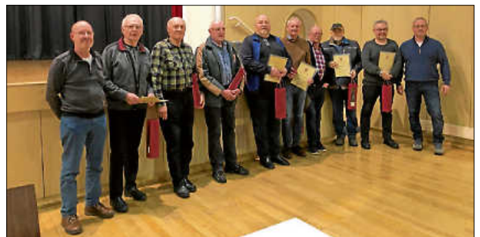
Gruppenbild aller anwesenden Jubilare

Höhepunkt der Versammlung waren auch in diesem Jahr die zahlreichen Ehrungen.