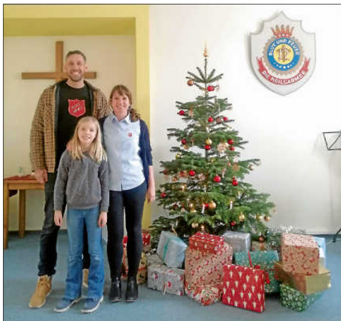
Familie Baker von der Heilsarmee in Göppingen

Organisiert wurde diese tolle Aktion von dem Kindergarten Arche Noah in Urbach unter der Leitung von Frau Baur.