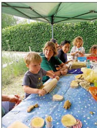
Es wurde ausdauernd geknetet und gewalzt

Nicht nur Kinder ließen sich inspirieren, sondern auch so manchen Papa oder Mama packte der Ehrgeiz, ein phantasievolles Tier aus Ton zu gestalten. Die umfangreiche Fotogalerie ist auf der Website www.waldpaedagogik-urbach.de zu finden.