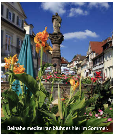
Beinahe mediterran blüht es hier im Sommer.

Geografisch und historisch facettenreich präsentiert sich die Auswahl der Städte. Von gotischen und Renaissance-Bauten bis hin zu imposanten Burgen wie in Wertheim und den charakteristischen Fachwerkfassaden von Mosbach und Schwäbisch Hall spiegelt das Buch die kulturelle Fülle und architektonische Pracht Baden-Württembergs wider.