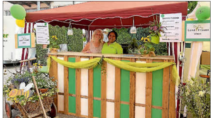
Es hat riesen Spaß gemacht an der „Spritz-Bar“ der Landfrauen

Auch diesmal hatten die Landfrauen beim traditionellen Straßenfest wieder einen nett dekorierten Stand. Trotz Unwetterwarnung hatte der Wettergott ein Einsehen, so dass wir von Samstag auf Sonntag vor der angekündigten Gewitterfront verschont blieben. Dafür gab es den ganzen Samstag über 30 Grad Hitze, die unerträglich war und dazu noch eine tropische Nacht bei über 20 Grad. Wir kamen vom Schwitzen gar nicht mehr raus. Aber abends liefen die leckeren „Spritz“-Cocktails, natürlich mit selbstgemachtem Holunderblüten- und Rosmarinsirup, mit und ohne Alkohol sowie einen süffigen Cocktail „Landfrauen Spritz“ mit einem Schuss „Hochprozentigem“ – eine Eigenkreation – wie geschmiert. Vor allem nach dem Deutschlandspiel war die Stimmung gigantisch!