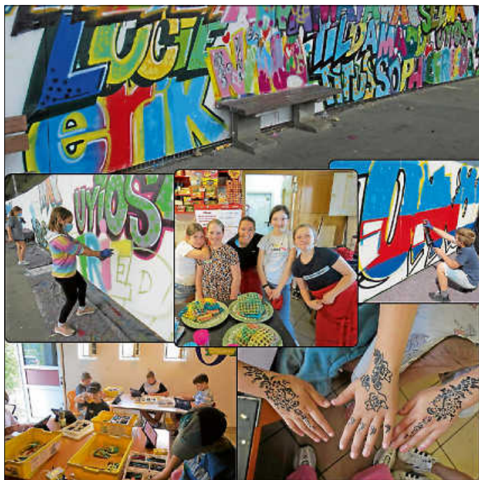
Bilder von den Workshops