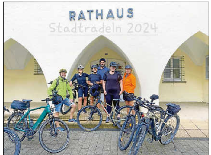
Team Rathaus beim „Stadtradeln“

Trotz Regen fand unsere Fahrradtour statt, schließlich wollten wir fürs „Stadtradeln“ und unser Team Kilometer sammeln. Pünktlich um 13:30 Uhr ging es los und rechtzeitig um 13:45 Uhr kam die Sonne – „Wenn Engel radeln!“. Die 27 km lange Tour ging über Rudersberg, den Berg hoch durch den Wald nach Necklinsberg über Berglen-Vorderweißbuch nach Buhlbronn, mit dem Ziel „Platzhirsch“ in Schorndorf. Ein leckeres Essen hatten wir uns jetzt verdient. Es war ein superschöner Nachmittag (Abend), wir haben etwas für die Fitness getan, den Kilometerstand bei Stadtradeln im Team nach oben getrieben und vor allem hatten wir ganz viel Spaß. Unser Kilometerstand kann sich „blicken“ lassen. Weiter so!