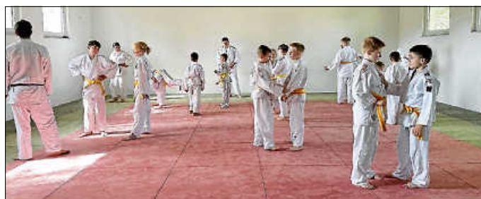
Dojo-Camp-Kids beim Training