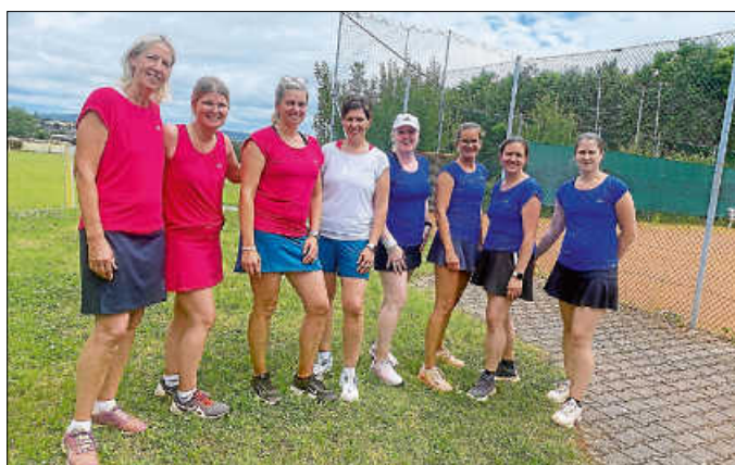
Damen 30 mit Gegnerinnen