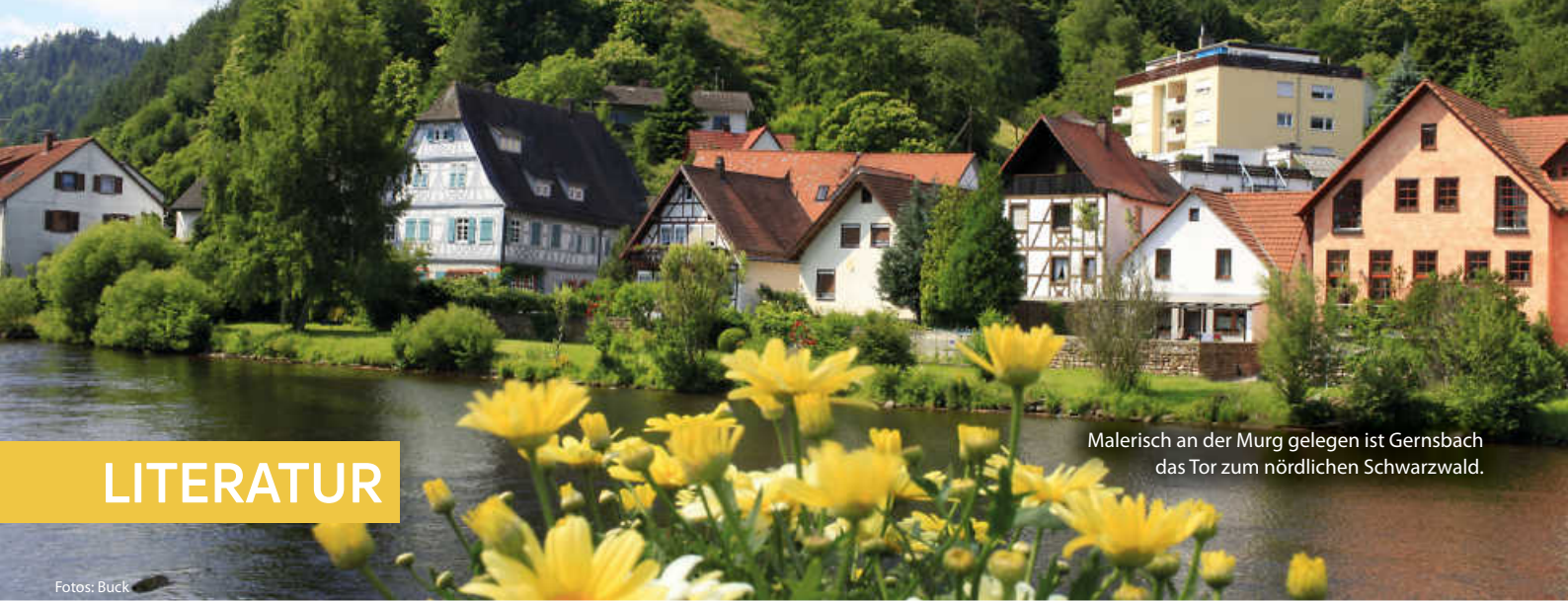
Malerisch an der Murg gelegen ist Gernsbach das Tor zum nördlichen Schwarzwald.