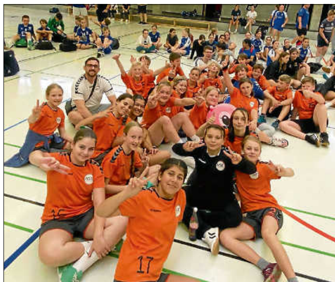
mD und wD gemeinsam beim Bezirksspielfest in Winnenden

Am Sonntag stand für die männliche D-Jugend der HSK Urbach/Plüderhausen das Bezirksspielfest in Winnenden an. Im ersten Spiel gegen den Gastgeber Winnenden konnten wir durch Rausfangen der Bälle und schnelles Umschalten das Spiel mit 12:4 für uns entscheiden. Das zweite Spiel gegen MTV Stuttgart war schon ausgeglichener. Ein schneller Angriff gelang uns durch diverse Fouls nicht so leicht. So verloren wir das knappe Spiel mit 5:6. Im dritten Spiel war das Weiterkommen mit einem Sieg gegen die HSG Gablenberg/Gaisburg möglich. Der Ansporn, in diesem Turnier eine Runde weiterzukommen, war also da. Im Spiel gegen GaGa legten wir stetig vor, doch der Gegner legte nach. In den letzten Sekunden gelang dem Gegner noch das entscheidende Tor, sodass wir denkbar knapp mit 8:9 verloren.