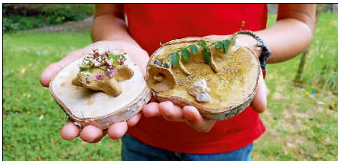
Sehr kreative Werke entstanden aus Ton

Seeungeheuer, Wasserschlangen, Quallen, Oktopusse, Fische, Schildkröten und Seepferdchen und noch viel mehr Tiere entstanden beim Mitmachangebot der Urbacher Waldpädagogik an der Schnitzfetzedede.