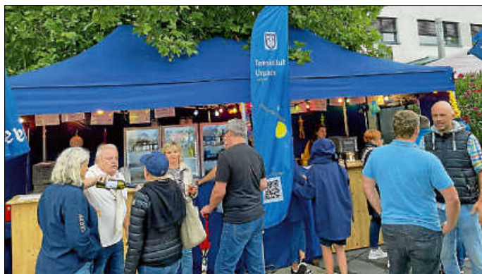
Die Bar ist eröffnet

nen top gestalteten Stand vor. Nach kurzer Einweisung ging es los für den TCU auf der Schnitzfetzede. Bei der Hitze hieß es viel trinken, was, muss jeder für sich entscheiden ;-). Eine neue Kreation namens Herren Aperol konnte auch serviert werden. Der sorgte für erstaunte, aber lächelnde Gesichter.