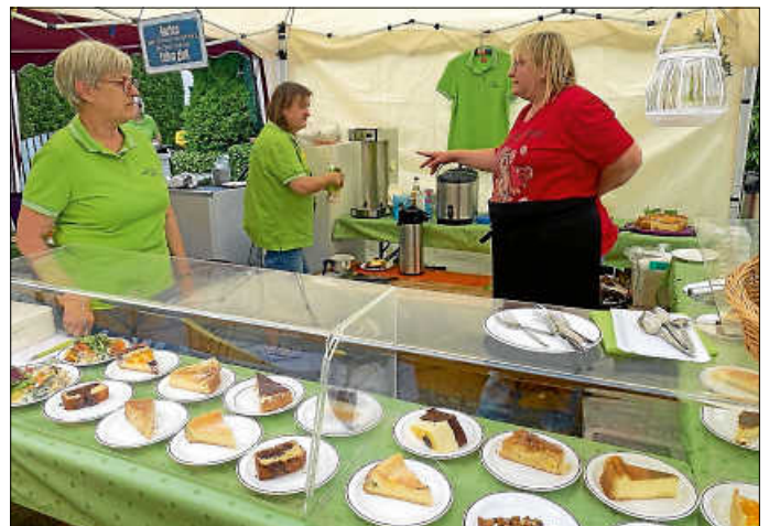
Die leckeren Kuchen am Sonntagnachmittag gingen „wie geschnitten Brot“

Viele Mitglieder und interessierte Gäste schauten dann auch am Sonntag bei kühleren Temperaturen an unserem Stand vorbei. Die Salate mit oder ohne Lachsrolle kamen wie immer super an und bei den leckeren, selbstgemachten Kuchen war am Nachmittag kein Krümel mehr übrig.