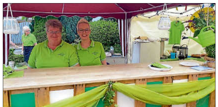
Auch die bunten Salat-Teller, mit und ohne Lachsrolle, ließen sich viele Festbesucher am Sonntag schmecken