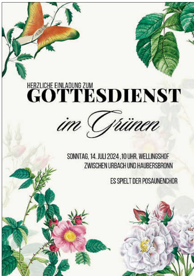
Gottesdienst im Grünen