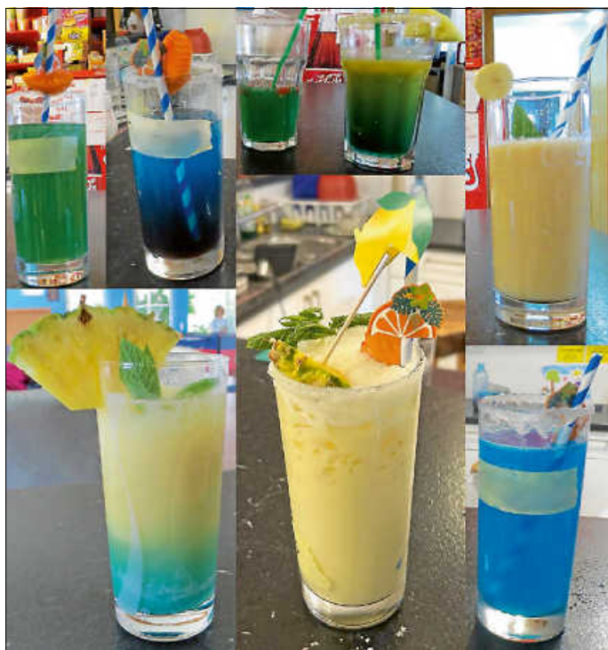
Unsere hübschesten Cocktails