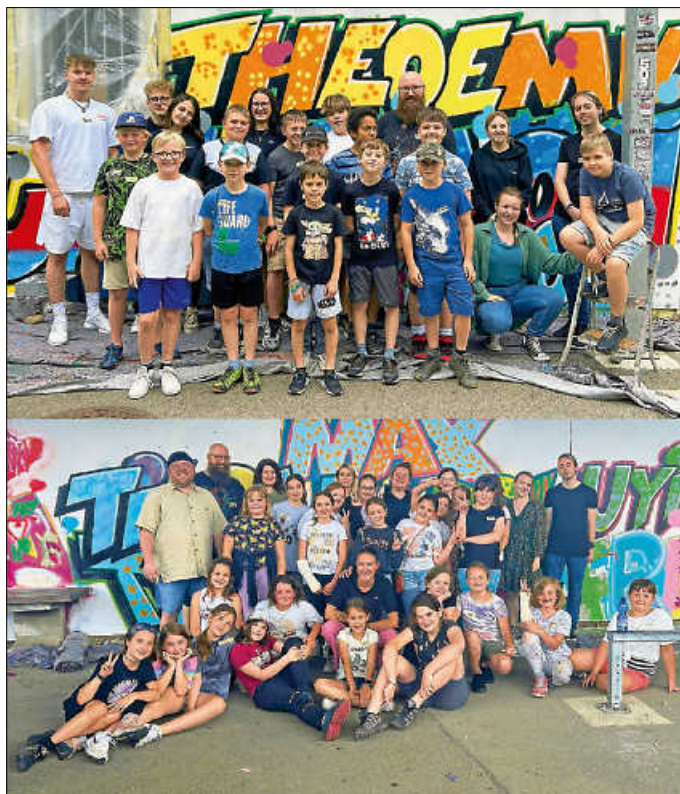
Gruppenbilder der Aktionstage