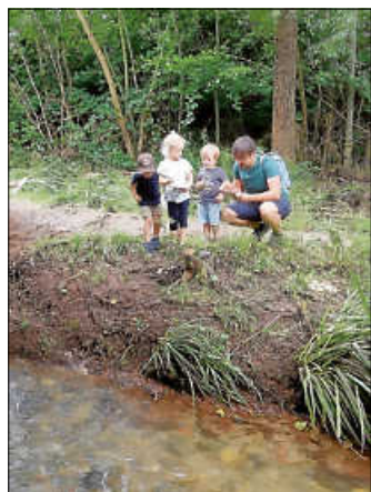
Groß und klein hatten Spaß bei der Rallye entlang des Urbachs

Bei der Rallye entlang des Urbachs mussten Tiere entdeckt werden und je nach Alter unterschiedlich anspruchsvolle Fragen dazu beantwortet werden. Kinder und Erwachsene hatten gleichermaßen Spaß dabei.