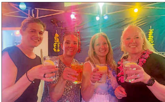
Let's fezt auf der Schnitzfetzedeg beim TCU. Leckere Cocktails...