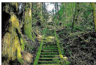
Jeder Weg beginnt mit einem ersten Schritt!

Der neue Judo-Anfängerkurs (für Kids ab 6 Jahren [Schulalter]) im Herbst 2023 startet am Montag, den 9. Oktober 2023.