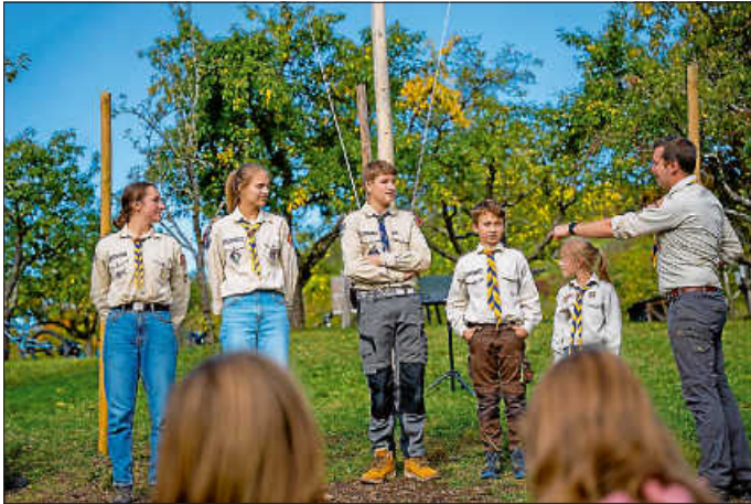
Unsere Altersstufen – Vom Forscher bis zur Leiterin

Und dennoch wollten wir letzte Woche unser diesjähriges Apfelfest feiern. Aber was ist das Apfelfest denn genau und wie haben wir den Apfelmangel gelöst?