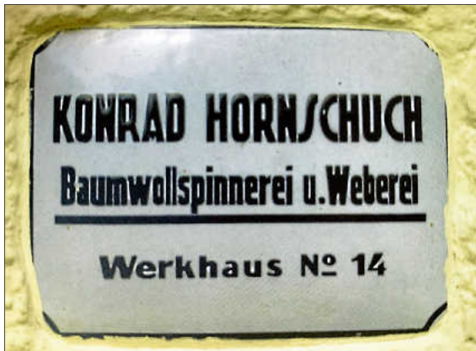
Schild an der ehemaligen Gebäudefassade

Haus wieder, da sie in der Mülhstraße in diesem Jahr ein eigenes Haus erbaute. Käufer war die Firma Hornschuch, die dann in dem Haus – dem „Werkhaus No. 14“ – Wohnungen für Werksangehörige einrichtete.