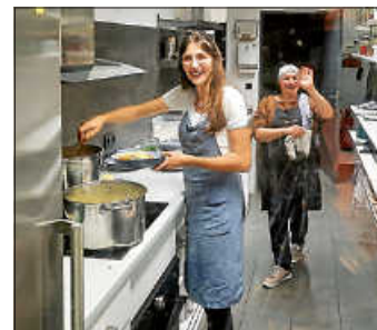
Ein sehr freundliches Bergerei-Team