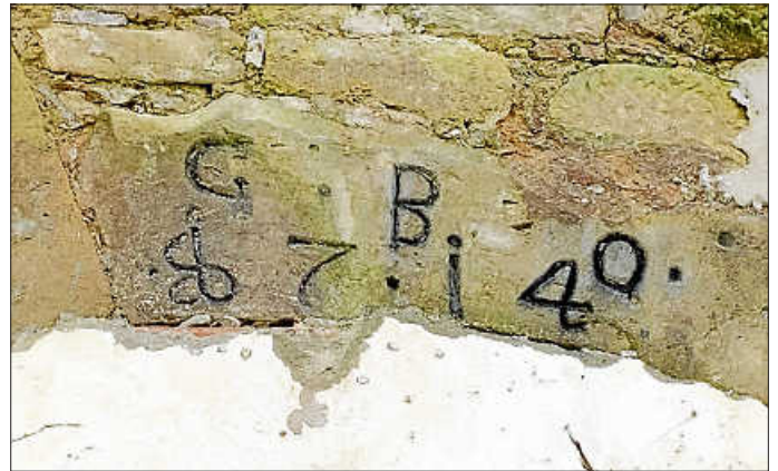
Inschrift über dem Gewölbekeller

Es ist daher wahrscheinlich, dass der „Ochsen“ und der „Pflug“ im selben Jahr erbaut wurden, vermutlich von Weingärtnern.