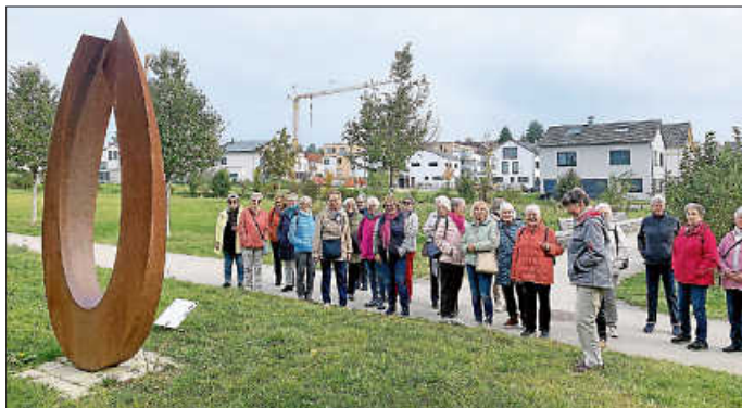
Die Schorndorfer Landfrauen an der Urbacher Tulpe