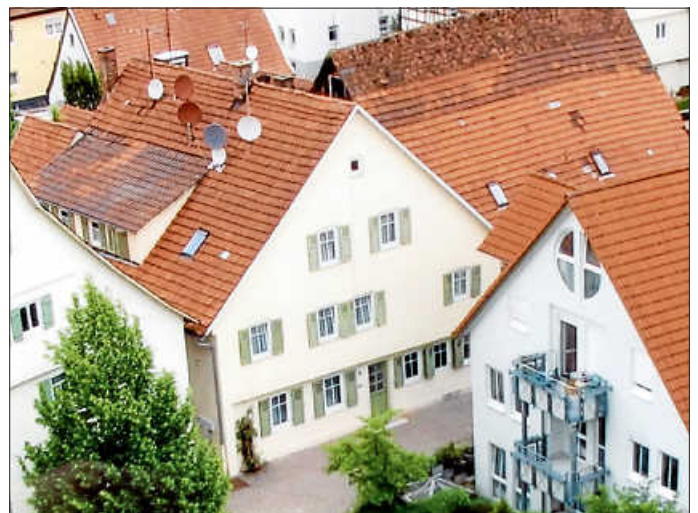
Das Gebäude des ehemaligen Pflugs am Kirchplatz