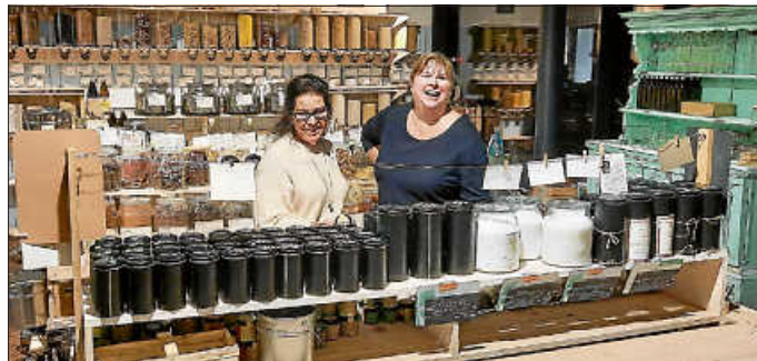
Regionale Produkte lagen in den Regalen, Glasdosen und großen Behältern

Wer wollte, konnte am Ende der Veranstaltung mit seinen mitgebrachten Behältnissen im verpackungsfreien Laden einkaufen. Der Austausch war wirklich sehr interessant, vor allem, um einfach auch mal das müllreduzierte Einkaufen vor Ort kennenzulernen. Es war ein sehr schöner und entspannter Abend. Vielen Dank an alle Beteiligten und an das freundliche Team der Bergerei!