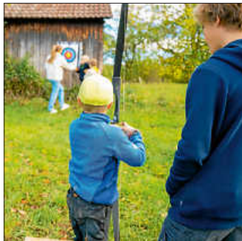
Wilhelm Tell – Mit Apfel aber ohne Sohn

Das Apfelfest ist unser jährliches Ranger- und Elternfest, an dem sich, wie der Name sagt, alles ums Thema Äpfel dreht. Ob selbst Apfelflammkuchen über offenem Feuer backen, Apfelsaft pressen, einen eigenen Apfeldruck herstellen oder sogar Bogen schießen in Wilhelm-Tell-Manner, hier ist für jeden etwas geboten. Und unsere Ranger-Eltern durften natürlich mitmachen.