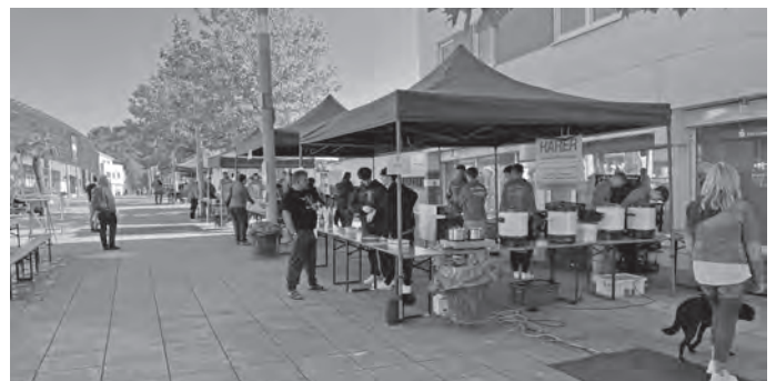
Die Versorgungsmeile des SCU auf dem Marktplatz hatte später alle Hände voll zu tun, um die Halbmarathon-Finisher und ihre Fans mit Essen und Trinken zu versorgen - eine ungewohnte Aufgabe, vor allem für die jungen Fußballer, die sie aber mit Bravour erledigt haben.