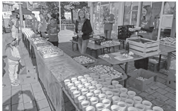
Die Ruhe vor dem Sturm - beste Versorgung für die Läuferinnen und Läufer

Zusammen lässt sich eben vieles stemmen!