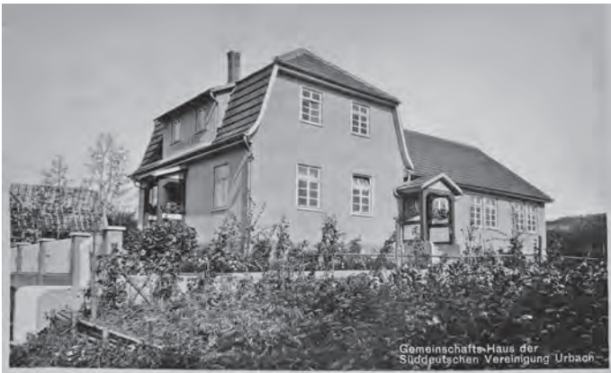
Das Haus Ebenezer im Jahr 1930