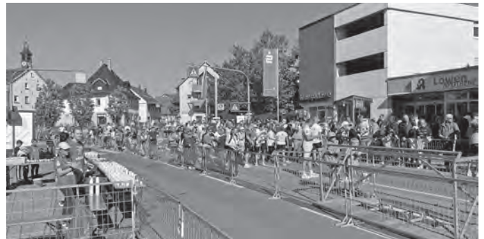
Super Stimmung an der Strecke und am Ziel