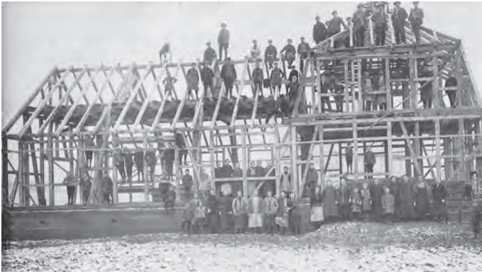
Richtfest des Hauses im Februar 1928