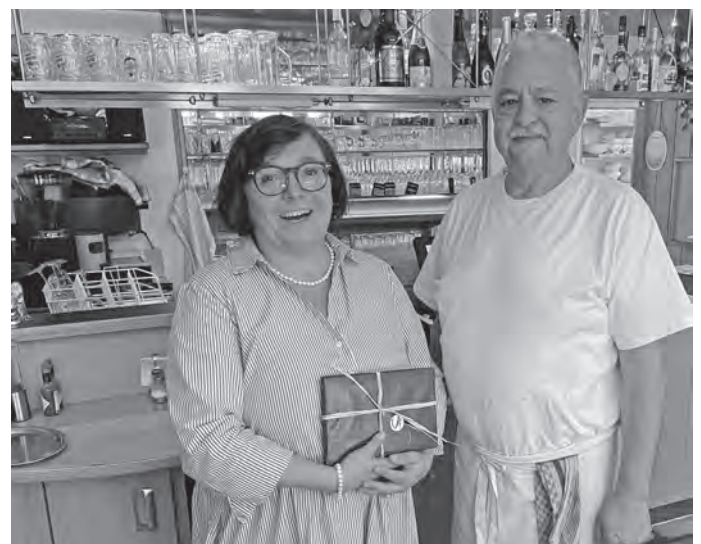
.. und einem Wanderführer.