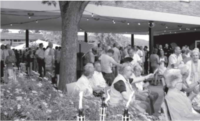
Bei herrlichem Wetter und südländischer Atmosphäre findet im Hof der Atriumschule der Sommerempfang der Gemeinde statt. Schwer fällt es an diesem tollen Abend den vielen Gästen aus Nah und Fern, nach Hause zu gehen.