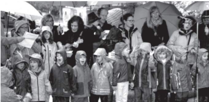
In diesem Jahr hat es nach langer Zeit während der Maibaumfeier mal wieder geschüttet, aber das machte den wettererprobten Kindern vom Waldkindi (und ihren Eltern) überhaupt nichts aus – „Singing in the Rain“ oder „Rain in May, wash your worries away!“