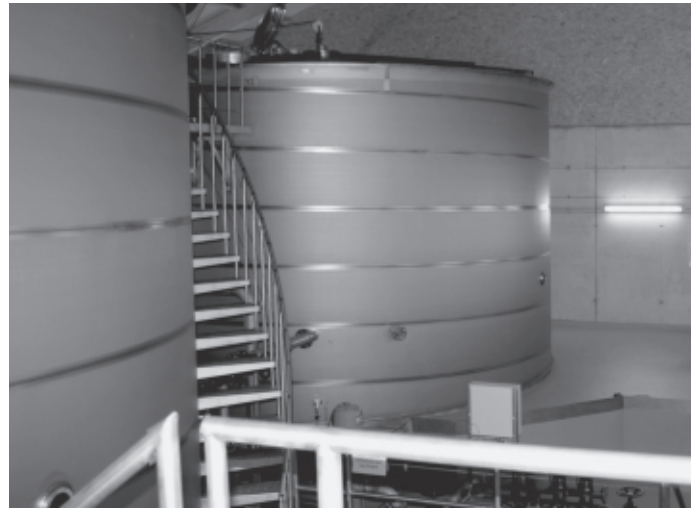
Am Hegnauhof wird der neue Wasserhochbehälter der Urbacher Wasserversorgung eingeweiht. Das mit allen weiteren Arbeiten und Rohverlegungen rund 865.000 € teure Projekt sorgt für eine höhere Versorgungssicherheit der Urbacher Haushalte und vor allem des Urbacher Industriegebiets.