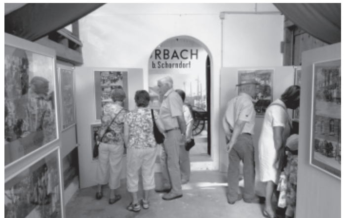
Im Museum „Farrenstall“ beginnt mit der traditionellen Museums-hocketse die Ausstellung „Urbacher Kinderfeste in der Vergangenheit“, die großen Anklang sowohl bei denen, die damals die Kinder beim Fest waren, als auch bei den Schulkindern von heute findet.