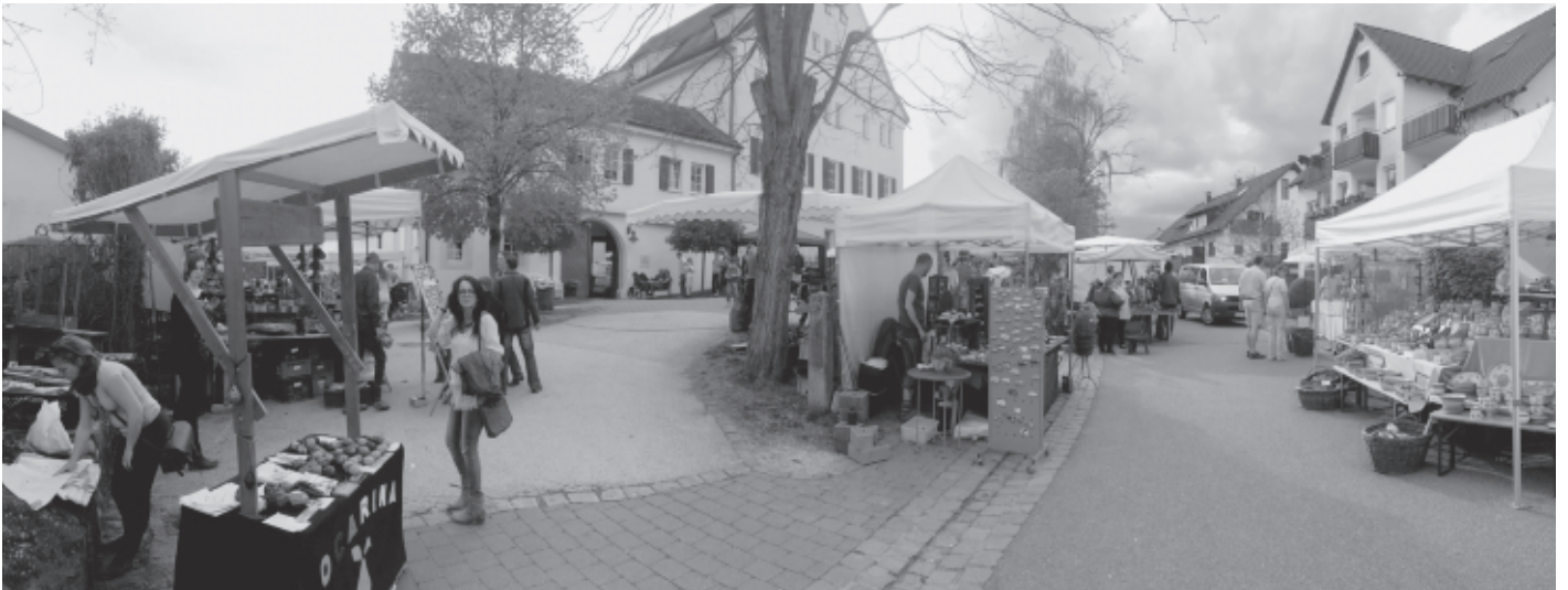
Wie jedes Jahr wird das Gelände rund um das Schloss Urbach zum Mekka für die Freunde von Töpferware und Keramik. Der Remstaler Töpfermarkt ist weit über die Grenzen Urbachs hinaus dafür bekannt.