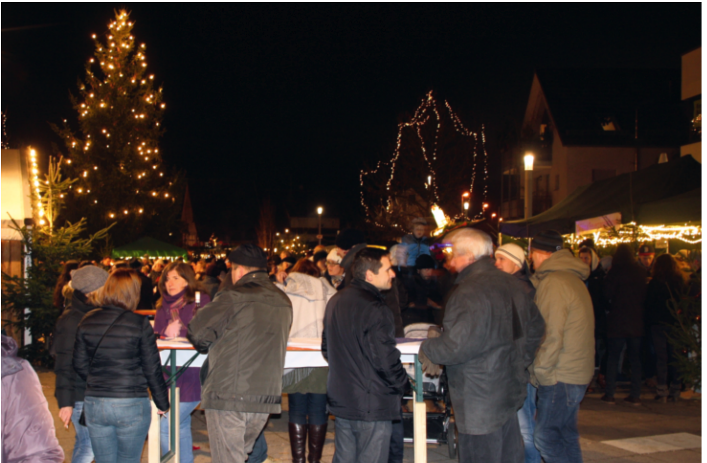
Die gesamte Belegschaft der Urbacher Gemeindeverwaltung wünscht frohe Weihnachten und ein glückliches neues Jahr!