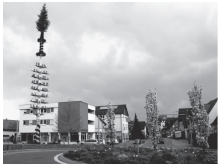
Der Urbacher Maibaum ziert wieder für einen Monat den Marktplatz in der Urbacher Mitte. Er gehört zu den größten und schönsten in der Umgebung, wie allgemein befunden wird.