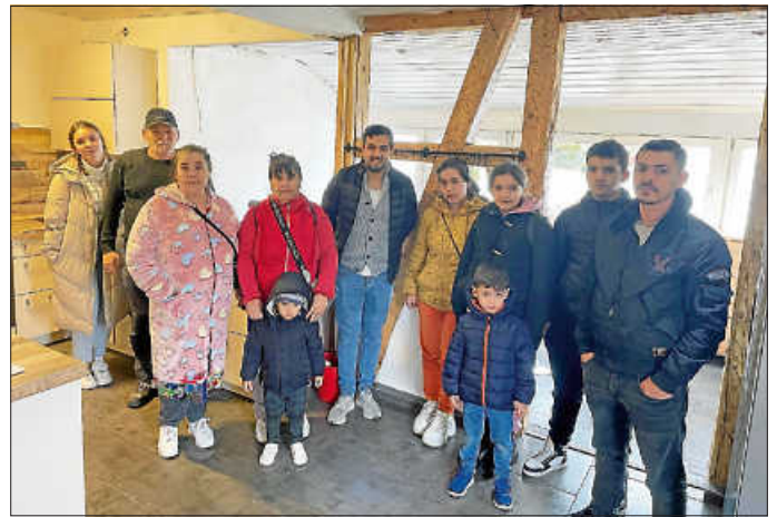
Eine neu zugewiesene Familie aus der Ukraine mit Kindern und Großeltern freuen sich über ein sicheres Zuhause in Urbach

Möglich wurde dieser Kraftakt, weil es nach wie vor Haus- und Wohnungseigentümer in Urbach gibt, die bereit gewesen sind, privaten Wohnraum an die Gemeinde zu vermieten zur Unterbringung dieser hilfe- und schutzsuchenden Menschen. Dafür ist die Gemeinde äußerst dankbar! Ohne diese Bereitschaft wäre die Gemeinde nicht in der Lage gewesen, auch nur einen kleinen Bruchteil der vorgeschriebenen Aufnahmequote zu erfüllen, da eigene Unterbringungskapazitäten längst erschöpft sind.