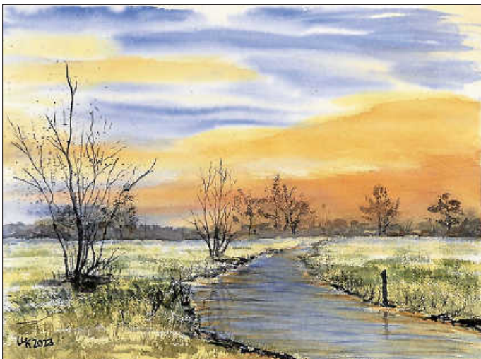
"50+Abendstimmung" ist der Titel dieses Bildes, das unter anderem bei der Ausstellung auf Schloss Filseck zu sehen sein wird

Eine herzliche Einladung an alle Urbacher Freunde und Bekannte erfolgt zur Vernissage am Freitag, 1. März 2024 um 19:30 Uhr im Leutrum-Saal.