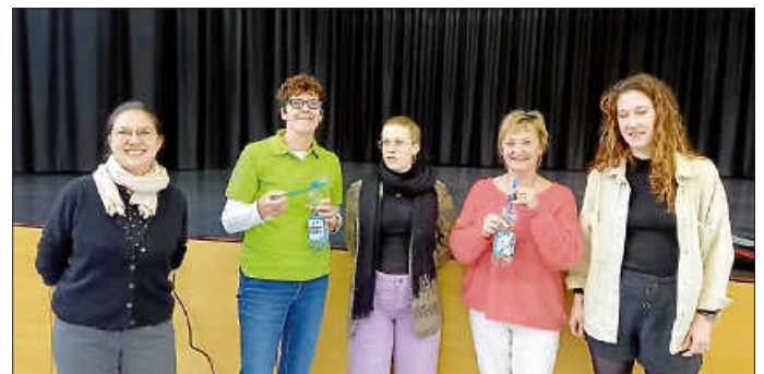
03.02. in Mutlangen mit den drei Workshopleiterinnen