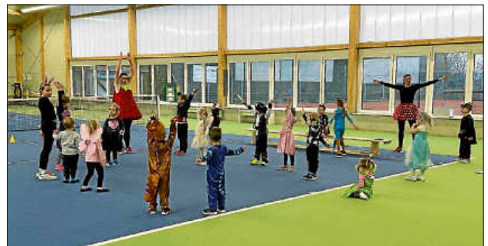
Kids Club Fasching

Hase, Elsa, Minnie Mouse, Meerjungfrau, Pirat, Hexe, Erdbeere, Skelett, Cowboy ... und sogar die Polizei. Was ist denn da los beim TCU?