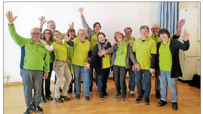
20.01. in Lorch

Insgesamt 15 Chormitglieder von ChorArt zwanzigelf besuchten am 20.01. bzw. am 03.02.24 die Fortbildungswshops des Chorverbands Friedrich Silcher für Chorsänger/-innen.