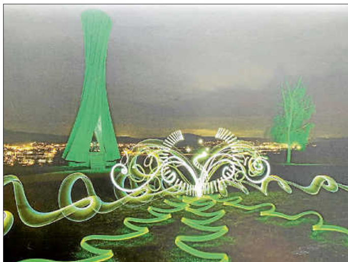
Turm an der Birke