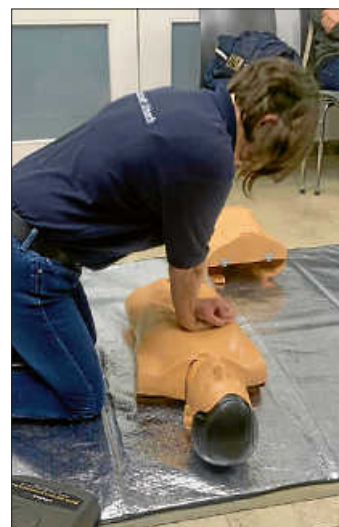
Die lebensrettende „Herz-Druck-Massage“ – wie die richtig angewandt wird, wurde an einer Übungspuppe demonstriert