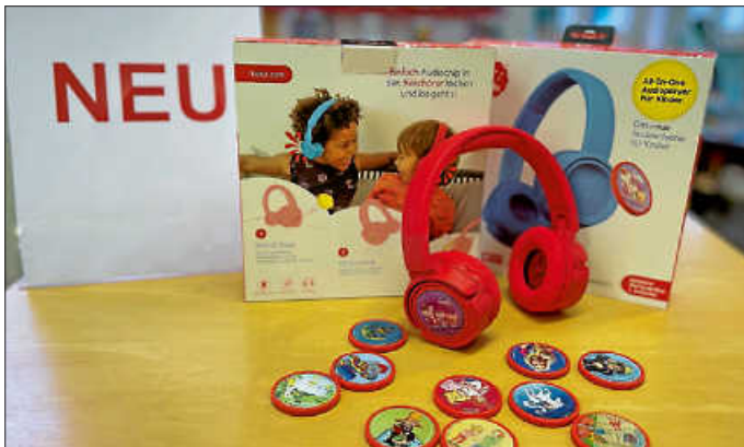
Neu im Bestand: Kekz-Kopfhörer für Kinder

Für unsere jüngsten Mediatheksbesucher/-innen gibt es jetzt etwas Neues zu entdecken: die „Kekz-Kopfhörer“ mit Audio-Chips. Ganz ohne Bildschirm, Internet oder Kabel funktioniert dieses besondere Hörmedium kinderleicht. Einfach den Audio-Chip (Kekz) außen an die Ohrmuschel des Kopfhörers klicken und schon wird eine Geschichte oder Musik abgespielt. Die Kopfhörer eignen sich für Kinder ab drei Jahren und können mit einer Akkulaufzeit von 15 Stunden auch gut unterwegs genutzt werden. Die maximale Lautstärke ist auf 85 Dezibel begrenzt.