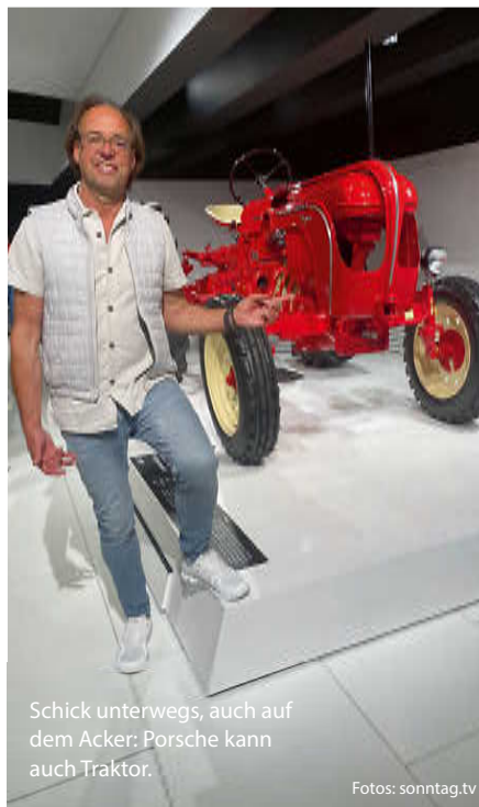
Schick unterwegs, auch auf dem Acker: Porsche kann auch Traktor.