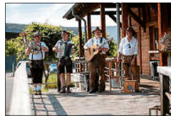
... BESTE UNTERHALTUNG!

Am kommenden Sonntag findet zum ersten Mal die kleine Schlosshocketse statt. Ab 11:00 Uhr gibt es neben kühlen Getränken und Weißwurstfrühstück auch leckeren Kuchen und Kaffee zum Verzehr vor Ort oder zum Mitnehmen. Umrahmt wird das Ganze durch die unterhaltsame Musik der „GOISSROINER“.