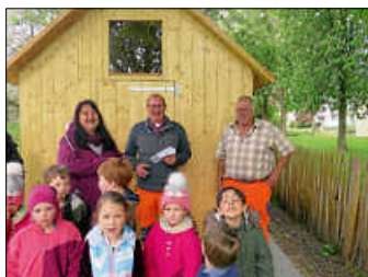
Nach zweitem Absatz Foto: Schloss-Kindergarten

Zaun steht nun schon seit einiger Zeit und markiert das Gelände. Jetzt hat der Bauhof der Gemeinde Urbach noch ein weiteres schmuckes Stück hinzugefügt. Zur Freude der Kinder steht nun ein hölzernes Spielgerätehaus auf dem Spielplatz.