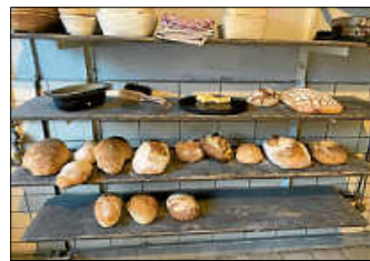
Frisch gebackene Brote im Oberurbacher Backhaus