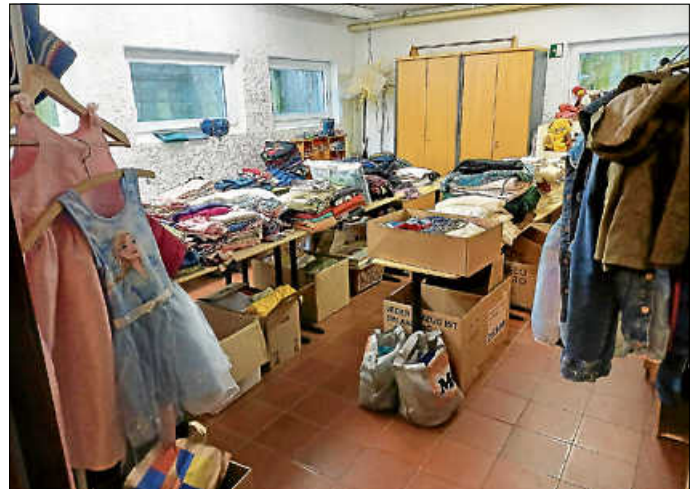
Kleiderkammer im UG der Friedenskirch

wird durch Herrn Martin Sommer , der auch schon zuvor sich darum kümmerte, als Hauptverantwortlichem geführt. Er wird dabei durch andere Ehrenamtliche unterstützt. Im Moment ist die „Kleiderkammer“ gut mit Kleidung in allen Größen ausgestattet. Sollte „Nachschub“ benötigt werden, wird wieder hier im Blättle ein Spendenaufruf veröffentlicht.