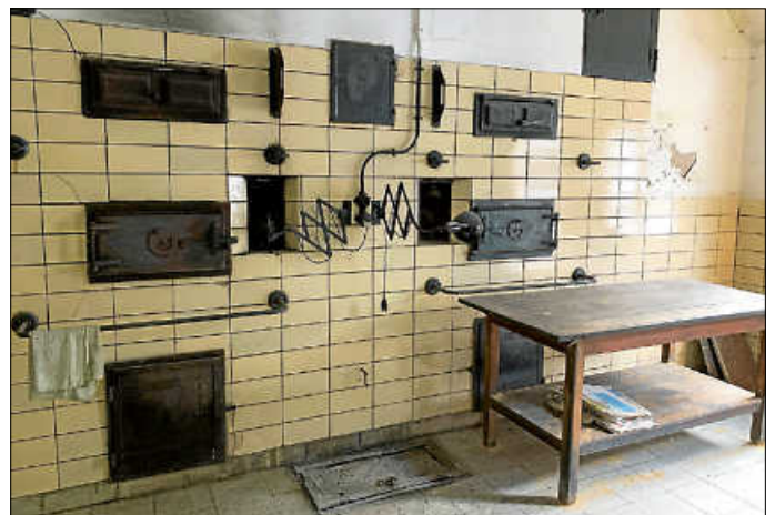
Im Inneren des Unterurbacher Backhauses im Größenwiesenweg 3

Unterurbach bekam 1851 dennoch ein erstes Gemeindebackhaus, in dem ein großer und ein kleiner Backofen untergebracht waren. Es lag „mitten im Dorf, neben Hirschwirt Schabels Witwe Garten und dem Gemeinen Weg“. In dieses Backhaus, das ursprünglich eine Brennerei des Bauern Joh. Georg Oettle war, wurde noch ein Waschkessel eingebaut, dann aber 1859 wieder herausgenommen und durch einen Dörröfen ersetzt, „weil dafür ein weit größeres Bedürfnis bestand“. Schnitz und Hutzeln aus Äpfeln und Birnen sowie gedörnte Zwetschgen erzeugte man in diesem Dörröfen für den Eigenbedarf und für den Verkauf, eine alte „Spezialität“ der Urbacher, auf die auch ihr Neckname „Schnitzfetzer“ zurückgeht.