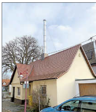
Das Oberurbacher Backhaus in der Haubersbronner Straße 11

Oberurbach besaß im Jahr 1810 über 90 Back- und Dörröfen, die von einzelnen Haushaltungen allein oder in Gemeinschaft mit Nachbarn erbaut und vorwiegend zum Dörren von „Werg“ (Flachs und Hanf) benützt wurden. Das Dörren von Flachs und Hanf wurde im Herbst in frei stehenden Backöfen vorgenommen. Weil die Fasern manchmal Feuer fingen, war nach der Landfeuerordnung von 1643 und 1684 das Dörren von Flachs und Hanf in Backöfen innerhalb der Häuser bei einer Strafe von zehn Gulden verboten. Die Backöfen standen auf geräumigeren Hofplätzen und ihre Entfernung zu den Häusern betrug 40 bis 50 Schritte. Ab 1837 bemühten sich die Oberämter, die Gemeinden für die Erstellung von Gemeindebacköfen zu gewinnen. Die Vorteile solcher Backöfen waren einleuchtend: Holzersparnis, Zeitgewinn, Vermeidung von Hausbränden, schmackhafteres Brot und Ähnliches. Dennoch sträubten sich die Gemeinden anfänglich gegen diese Einrichtung oder sie rangen sich nur zögernd zu einem diesbezüglichen Entschluss durch. „Nach umständlich gepflogenen Beratungen und nach vielen weitläufigen Debatten“ entschloss sich 1837 der Gemeinderat von Oberurbach, einen Gemeindebackofen probeweise auf dem Gemeindeplatz in der Burggasse, zwischen dem Bach und Adam Vogels Haus, erbauen zu lassen. Das Oberamt lobte den Entschluss des Gemeinderats und ließ „sein Wohlgefallen und seine Zufriedenheit hierüber erkennen“.