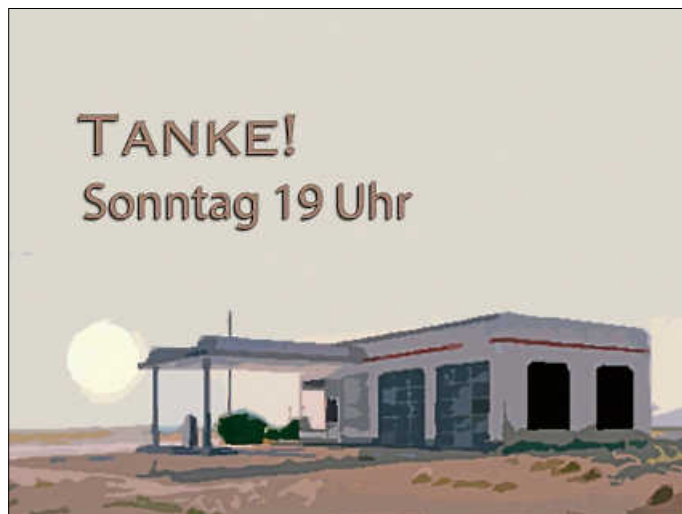
Vorschau: 2. Juni