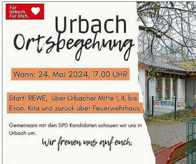
Evangelischer Kindergarten Urbach

Fr., 24.05.24, 17 Uhr Ortsbegehung, Treffpunkt Rewe Eingang Gemeinsam mit den SPD-Kandidaten schauen wir uns in Urbach um.