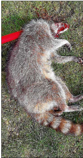
Ein mit dem Staupe-Virus infizierter Waschbär wurde Anfang des Monats in der Unteren Seehalde entdeckt und musste vom Stadtjäger von seinen Qualen erlöst werden.

Aufmerksame Anwohner hatten das Tier, das sich bereits sichtbar quälte und sich völlig atypisch für Wildtiere verhielt, entdeckt und über die Polizei den „Stadtjäger“ alarmiert. Der für Urbach zuständige Stadtjäger fing das schwer kranke Tier ein und erlöste es außerhalb des Ortsgebiets von seinen Qualen. Der Waschbär wurde daraufhin zum Chemischen und Veterinäruntersuchungsamt gebracht, wo der Verdacht auf Staupe-Befall nun bestätigt wurde.