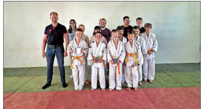
Erfolgreiche Prüflinge vom 16. Juli 2024