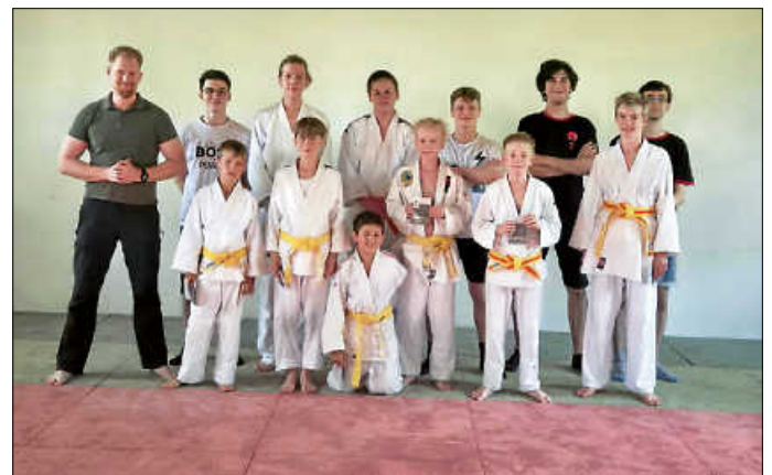
Erfolgreiche Prüflinge vom 19. Juli 2024