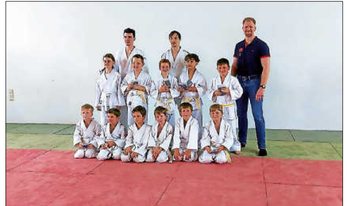
Erfolgreiche Prüflinge vom 15. Juli 2024

30 Prüflinge wollen ihren nächsten Gürtel – Kyu-Prüfungen beim JVV