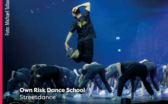
Own Risk Dance School Streetdance