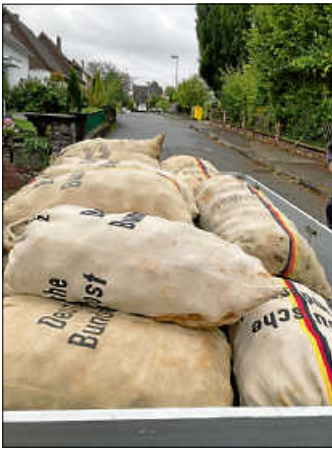
Am Ende sind es doch noch viele volle Säcke geworden!