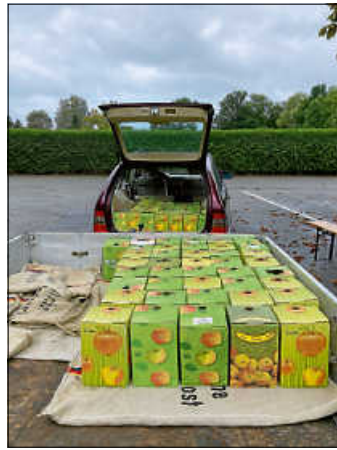
Nun ist unser Apfelsaftlager wieder aufgefüllt