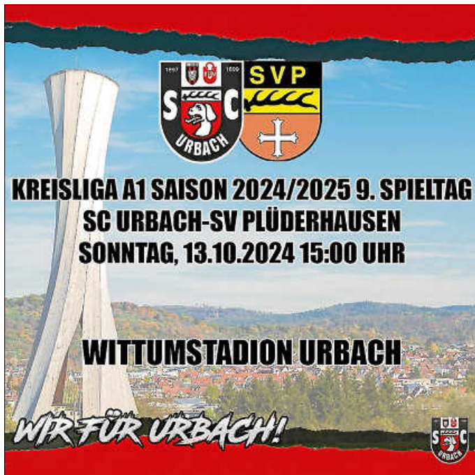
Auf ins Wittumstadion am kommenden Sonntag!

Am kommenden Sonntag empfangen wir im Wittumstadion zum Lokalderby unseren Nachbarn vom SV Plüderhausen. Nachdem beim letzten Spiel in Plüderhausen der Derbybann gebrochen wurde, wollen wir gemeinsam mit den hoffentlich zahlreichen Urbacher Fans und Zuschauern vor Ort einen weiteren Derbysieg einfahren. Für beste Bewirtung wird von unserer A-Jugend gesorgt sein.