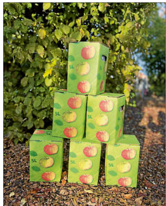
„Der leckerste Apfelsaft aus Urbach“

Über den frisch gepressten Saft haben sich die Kinder sehr gefreut: „Er schmeckt so gut! Es ist der leckerste Apfelsaft aus Urbach“ :-)