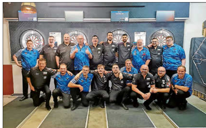
DC Urbach Buli und Spieler des DC Hawks Vilsbiburg