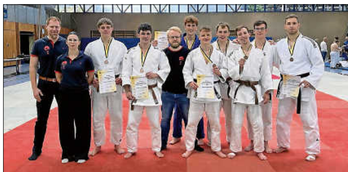
JVU-Mannschaft mit Betreuer team

Mit Bilderbuch-Siegen über eine Kampfgemeinschaft aus dem Ostalbkreis sowie die Sportvereinigung Besigheim mit 5 zu 0 und zwei knappen Niederlagen gegen die Teams aus Backnang und Steinheim mit je 2 zu 3 ging es gegen Gastgeber Bietigheim um einen Medaillenrang.