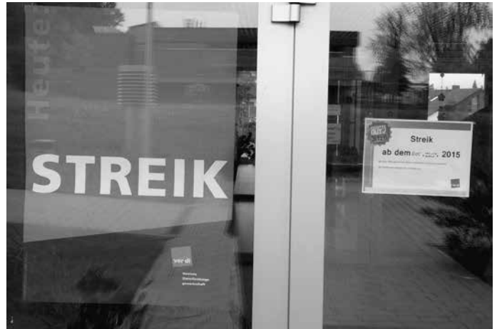
Die Erzieherinnen in den Urbacher Kindergärten und Kindertagesstätten befinden sich im Streik. Kindern und Eltern stehen nur Notgruppen zur Verfügung.