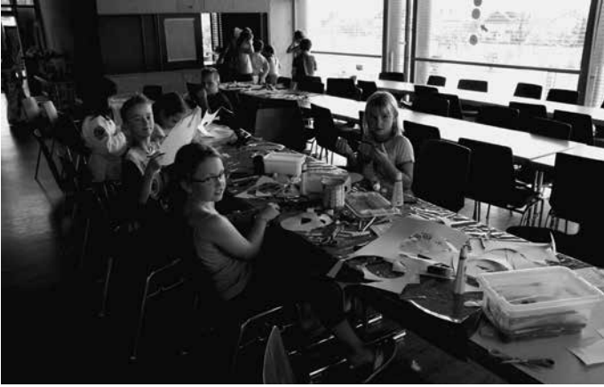
Immer was los ist bei der Sommerferienbetreuung der Gemeinde in der Atriumhalle und drum herum.