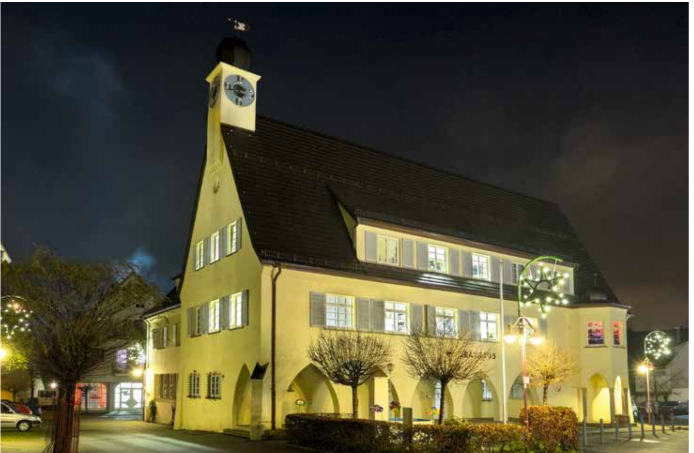
Die gesamte Belegschaft der Urbacher Gemeindeverwaltung wünscht frohe Weihnachten und ein glückliches neues Jahr!