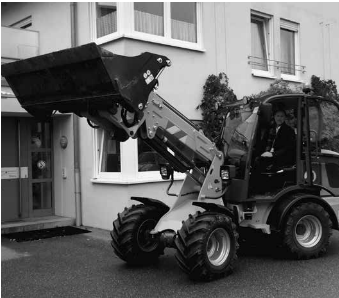
Der Gemeindebauhof erhält einen neuen Radlader als Ersatz für den über 20 Jahre alten Atlas-Lader.