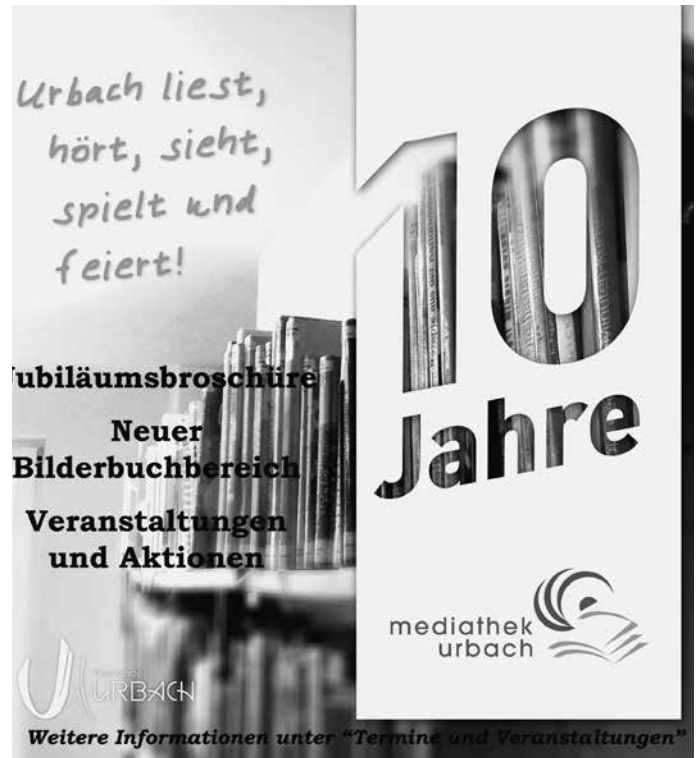
Im Rahmen einer kleinen Veranstaltungsreihe und mit einer interessanten Broschüre begeht die Urbacher Mediathek ihr 10-jähriges Jubiläum.