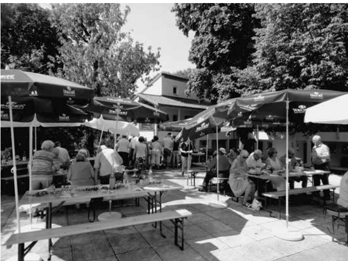
Urbachs Seniorinnen und Senioren veranstalten ein Picknick mit Grillen und allerlei Leckereien im Schlosshof.