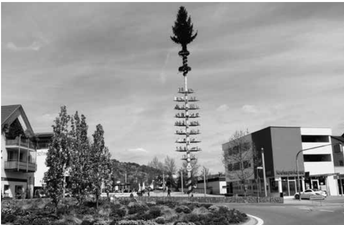
Der Urbacher Maibaum ziert wieder für einen Monat den Marktplatz in der Urbacher Mitte. Er gehört zu den größten und schönsten in der Umgebung, wie allgemein befunden wird.