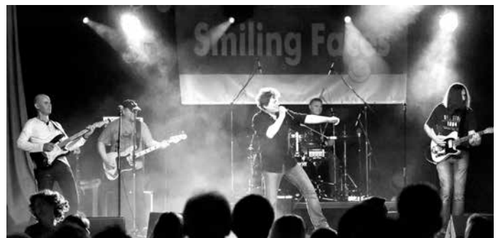
Moderne Musik mit Pop und Rock bieten die „Smiling Faces“ ihren Gästen. Wie jedes Jahr pilgern mehr als 500 Fans zu der Plüderhäuser/Urbächer Band und feiern gemeinsam mit der Band und ihren Freunden.