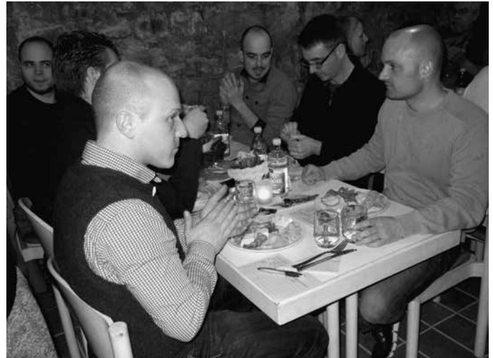
Eine Reihe von Veranstaltungen bringt auch kulturell Farbe in den Frühling. Zum 32. Mal findet das traditionelle Mostseminar statt.