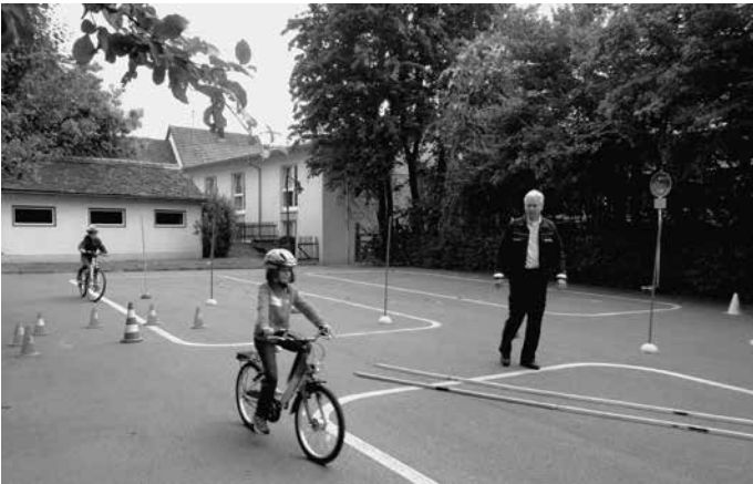
Vereine, Kirchen, Betriebe und Privatleute sorgen alljährlich mit einem attraktiven Ferienprogramm dafür, dass es auch den daheim gebliebenen Kinder in den Schulferien nicht langweilig wird, wie hier beim Fahrradtraining mit der Kreisverkehrswacht.