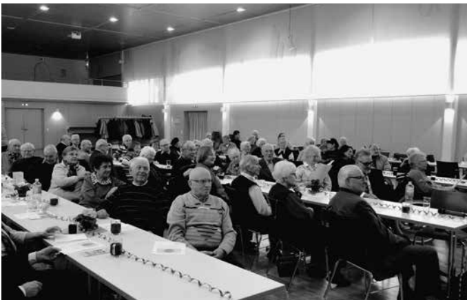
In der Auerbachhalle findet das traditionelle Jahrgangstreffen der über 80-Jährigen statt. Bei Kaffee und Kuchen sowie einem bunt gemischten Unterhaltungsprogramm feiert man das Wiedersehen in geselliger Runde.