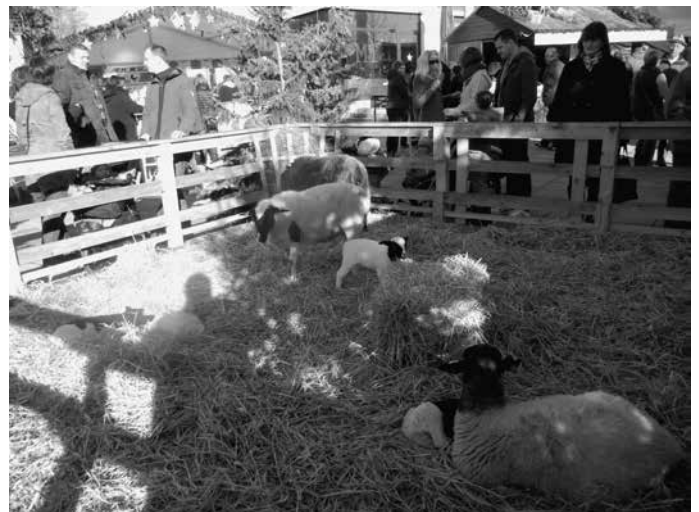
Bei fast frühlinghaften Temperaturen und strahlendem Sonnenschein findet der 32. Urbacher Weihnachtsmarkt statt. Von Beginn des Marktes an ist dieser sehr gut besucht und an den rund 60 Ständen mit Weihnachtlichem, Selbstgemachtem, Kunsthandwerk, Grünschmuck, Glühwein, Bratwurst, Döner und vielem mehr herrscht buntes Treiben.