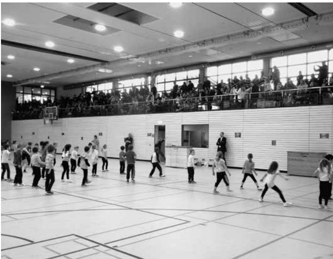
Im Rahmen einer kleinen Einweihungsfeier wird die Wittumhalle nach rund sechs Monaten Bauzeit frisch saniert und fast wie neu den Urbacher Sportlerinnen und Sportlern wieder zur Verfügung gestellt. Alles in allem hat die Gemeinde rund 2,5 Mio € für die Generalsanierung ausgegeben.