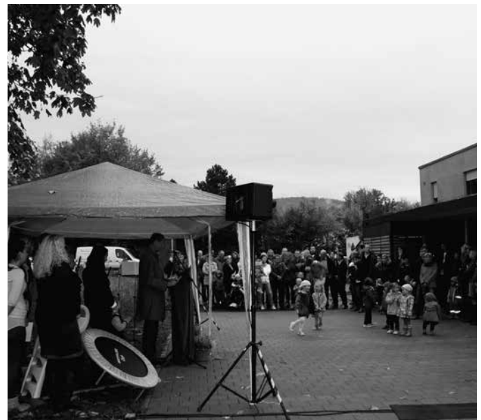
Die „Kita Wiese“ wird im Rahmen einer kleinen Feier offiziell ihrer Bestimmung übergeben. Derzeit besuchen 21 Kinder die neueste Einrichtung der Gemeinde für die Kinderbetreuung – davon 7 Kinder unter 3 Jahren sowie 14 größere Kindergartenkinder in einer Ganztagesgruppe.