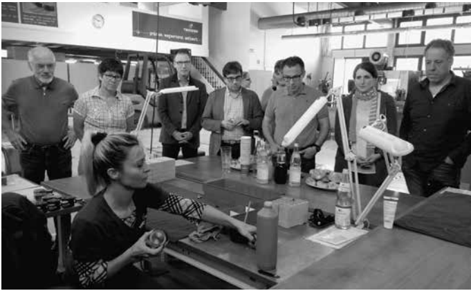
Der Gemeinderat besichtigt gemeinsam mit der Verwaltungsspitze mehrere Urbacher Betriebe, hier die Firma Tschorn in der Dieselstraße.