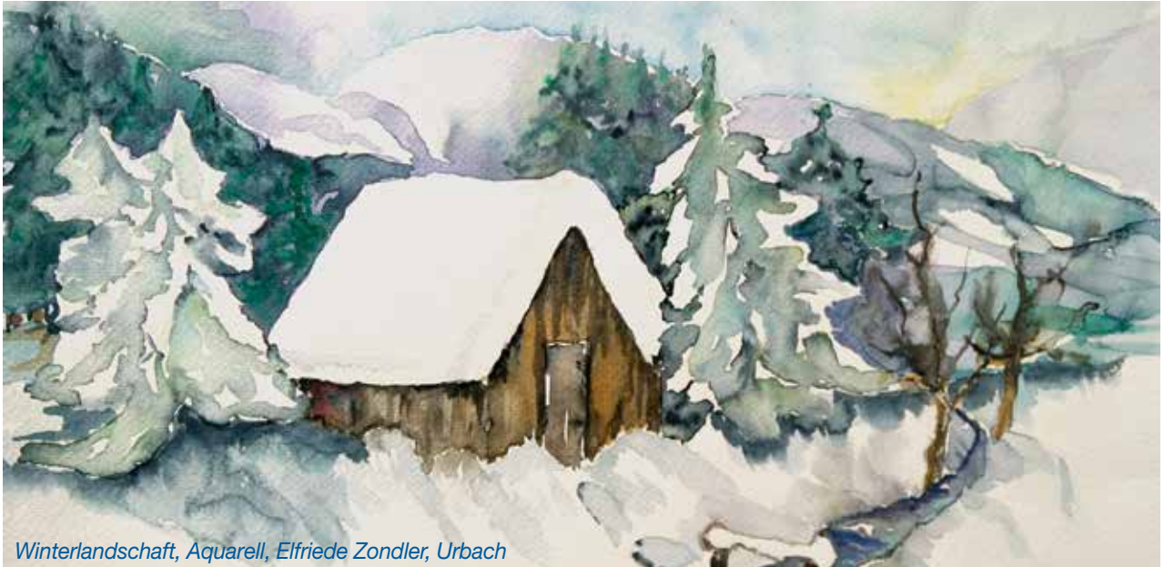
Winterlandschaft, Aquarell, Elfriede Zondler, Urbach