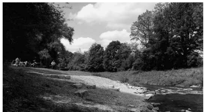
An der Rems wird ein neuer Grillplatz eingeweiht, der Wanderer und Radfahrer zum Verweilen einlädt und das Gewässer für Naturfreunde besser erlebbar macht.