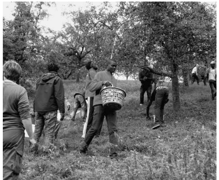
Die Apfelernte auf den Urbacher Streuobstwiesen läuft auf vollen Touren. Gute Mostobstpreise sorgen dafür, dass viele Stücke abgeerntet werden. Auch Bewohner der Flüchtlingsunterkunft beim Bauhof, wo seit Ende Juli 45 verfolgte Menschen aus verschiedenen Ländern wohnen, helfen freiwillig bei der Apfelernte.