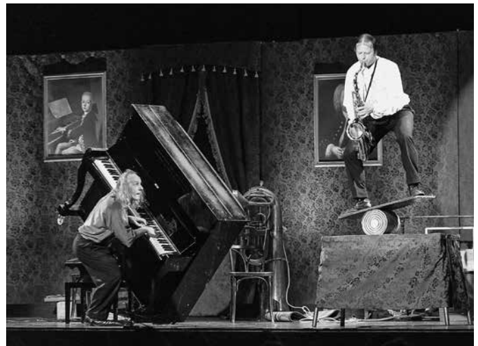
Die Reihe „Kabarett und Comedy“ geht auch schon ins 21. Jahr – hier mit einer Veranstaltung der beiden Musikclowns „Gogol und Mäx“.