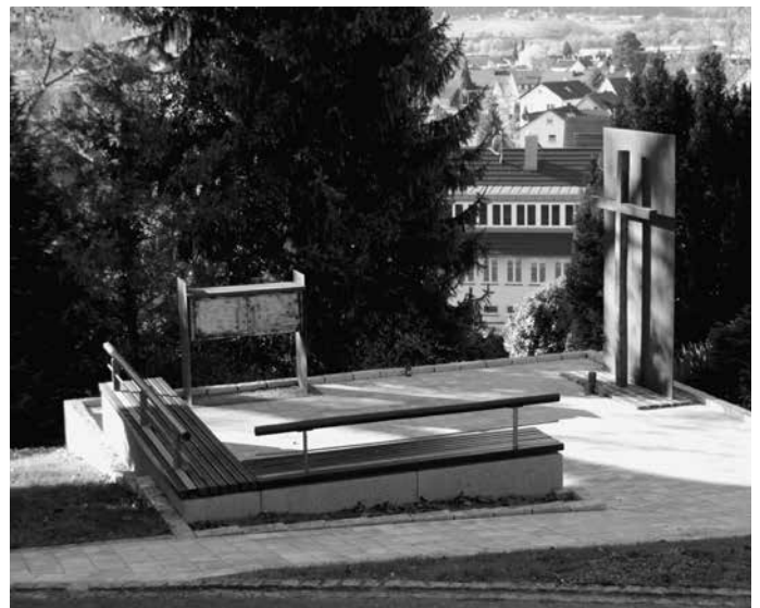
Auf dem Friedhof wird anlässlich der Gedenkfeier zum Volkstrauertag der „Platz der Stille“ eingeweiht. Dort haben Trauernde und FriedhofsbesucherInnen künftig die Möglichkeit, inne zu halten und für einige Momente dem Alltag zu entfliehen.