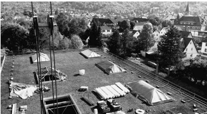
In (und auf) der Wittumhalle schreiten die Sanierungsarbeiten voran. Im Mai wird das Dach saniert. Aus Kostengründen müssen leider die bisher vorhandenen, aber sehr unterhaltungsintensiven Tageslichtkuppeln auf dem Dach entfernt werden.