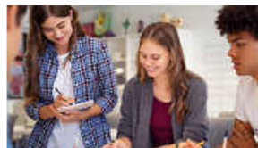
Berufliche Gymnasien TG, WG, SG

Berufliche Schulen mit Neigungsprofilen an der Akademie für Kommunikation Stuttgart!