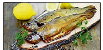
Frische geräucherte Forellen

Es ist wieder so weit. Wir werden am Gründonnerstag, 28. März 2024, Forellen räuchern. Bestellungen werden ab sofort bis zum 17. März 2024 telefonisch unter 0151 40759482 oder per E-Mail info@sandtisch.de angenommen. Bitte immer den vollständigen Namen und die Tel.-Nummer mit angeben.