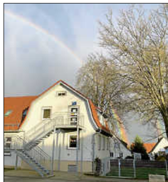
Das Kinderschüle heute mit Regenbogen

Zur Geschichte des Kinderschüles gehören natürlich auch die handelnden Personen. In den Geschichtsbüchern sind die bei der Errichtung 1901 Verantwortlichen Pfarrer Hartlieb (1891-1909),