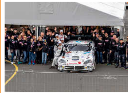
> Mit etwa 50 ehrenamtlichen Helferinnen und Helfern ist White Angel for Fly and Help jedes Jahr Bestandteil des 24h-Rennens am Nürburgring

Jetzt über den QR-Code direkt mit dem Teamchef in Kontakt treten und das Projekt aktiv unterstützen!