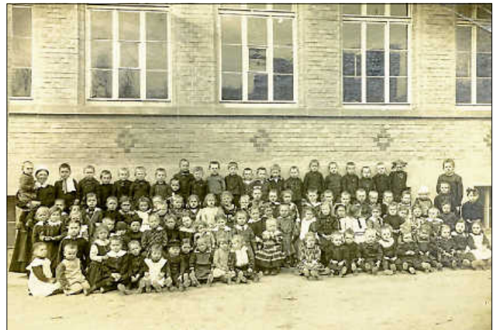
Die Kinder des Kinderschüles vor der Wittumschule. Foto von ca. 1917