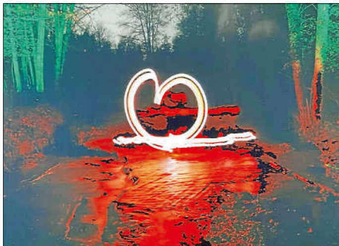
Und so sieht dann ein fertiges Bild aus

Die Bilder wurden direkt nach der Erstellung von Tobias Steinberg auf Fotopapier ausgedruckt. Somit erhielten alle ihr persönliches, selbst kreiertes Bild zum Andenken mit nach Hause.