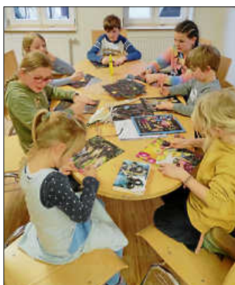
Am großen Basteltisch

Am vergangenen Freitag nahmen 7 Kinder am Programm der Mediathek teil und hatten eine schöne gemeinsame Zeit. Zunächst lauschten sie im Dachgeschoss einem Märchen von Astrid Lindgren, danach ging es eine Etage tiefer an den großen Tisch, wo sie eifrig mit Kratzbildern zum Frühling und Ostern beschäftigt waren. Wer wollte, konnte auch noch eine Papierblume aus alten Buchseiten und Pfeifenputzern basteln. Es war ein schöner Nachmittag, vielen Dank an alle, die dabei waren.