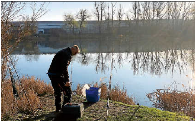
Anfischen bei tollem Wetter