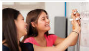
Kaufm. Berufskollegs Wirtschaft, Sprachen, Sport