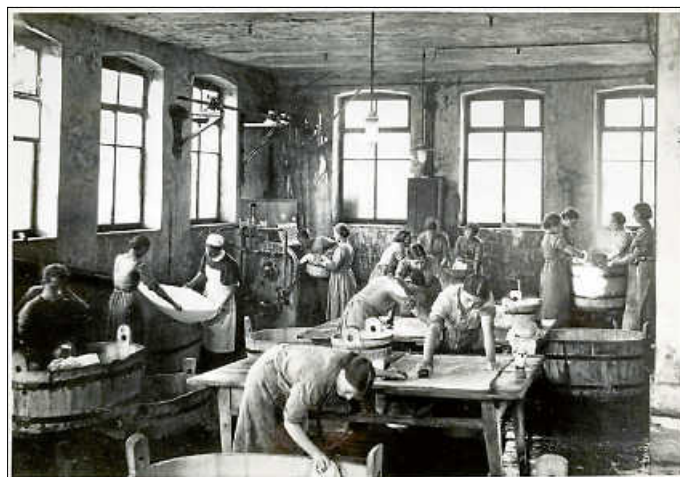
Die Wäscherei des Fürsorgeheims 1925

Dazu lädt die Baptistengemeinde Urbach sehr herzlich ein. Die Veranstaltung steht allen Interessierten jeden Alters offen.