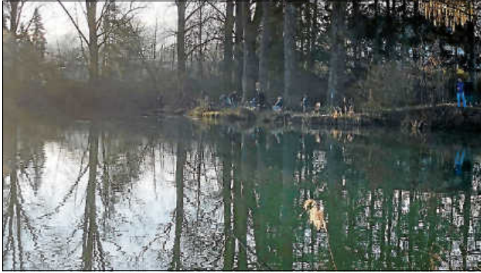
Das Warten auf den ersten Biss

Pünktlich um 07:00 startete am 03.03.2024 das diesjährige Anfischen der Anglerfreunde Urbach. Bei herrlichem Angelwetter nahmen ca. 35 Anglerfreunde an der Veranstaltung teil. An den meisten Plätzen zeigten sich auch die Fische in Beißlaune.