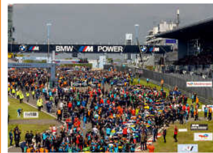
> Zehntausende Fans in der Startaufstellung gehen auf Tuchfühlung mit den Teilnehmern beim 24h-Rennen