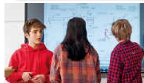
Berufsfachschule für Wirtschaft und Medien