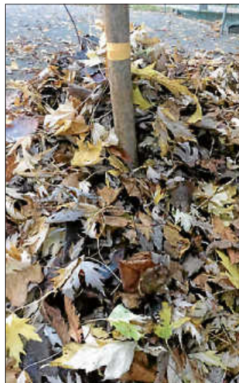
Laubhaufen im Garten

Der Herbst ist da und die Blätter an den Bäumen machen die Welt noch einmal so richtig schön bunt. Warum ist das eigentlich so und warum fallen die Blätter überhaupt ausgerechnet im Herbst alle auf einmal runter? Tatsächlich ist es eine lebensnotwendige Maßnahme, der sich die Bäume im Herbst stellen, damit sie für den Winter gut vorbereitet sind. Wenn die Temperaturen draußen längere Zeit nicht höher als 10 bis 15 Grad werden, schickt der Baum einen Botenstoff an die Stiele der Blätter, damit dort eine Art Verschluss gebildet wird. Dieser Verschluss wird dann im Laufe der Zeit hart und schwups ... das Blatt fällt ab. Allerdings zieht der Baum, bevor das Blatt ganz abgeschnürt ist, noch schnell wichtige Stoffe wie das Chlorophyll (das ja für die grüne Farbe verantwortlich ist) in die Zweige, Äste und den Stamm zurück. Er kann sie zum Wachsen im nächsten Winter wieder gut gebrauchen. Übrig bleiben im Blatt dann Farbstoffe wie das Karotinoid (wovon die Karotte ihren Namen hat), die dann dem Blatt die schöne bunte Färbung geben.