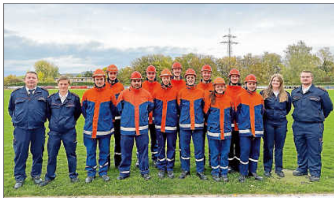
Die erfolgreichen Teilnehmer der Leistungsspange

Bei der Leistungsspange handelt es sich um die höchste Auszeichnung, die man in der Jugendfeuerwehr bekommen kann. Die Jugendlichen werden hier in fünf Disziplinen geprüft und ebenso wird auch das gesamte Auftreten bewertet. Bei den Disziplinen handelt es sich um: Kugelstoßen, Staffellauf, Schnelligkeitsübung, Löschaufbau, Fragenbeantwortung. Hier muss jeweils eine gewisse Zeit bzw. Weite erreicht werden. Bei den Fragen geht es sowohl um Feuerwehr-Themen als auch um politische Themen sowie die Allgemeinbildung.