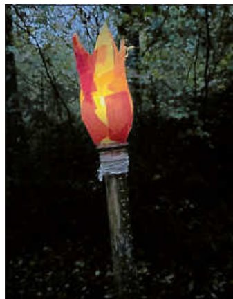
Unsere selbst gebastelten Fackeln

Nach einem Laternenlied machten sich alle auf zum Laternenlauf. Der Weg war mit Windlichtern beleuchtet. An einer Haltestelle erklangen erneut Lieder durch den Wald. Stolz trugen die Kinder ihre selbst gebastelten Fackeln. Zum gemeinsamen Abschluss haben noch einmal alle ein Laternenlied zusammen gesungen. Danach gingen die Kinder mit ihren Familien an den jeweiligen Bauwagen.