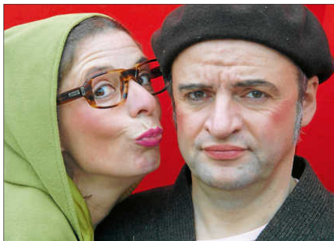
Ein Schauspiel mit zwei Clowns, einem Sofa, einer Apfelsine und einem Märchen für Kinder ab 4 Jahren

Freitag, 17. November 2023, 15.00 Uhr, Urbach, Atriumhalle Eintritt: 8,- € (Erwachsene), 5,- € (Kinder)