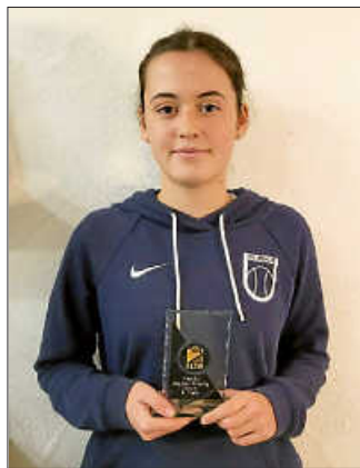
Toller 3. Platz