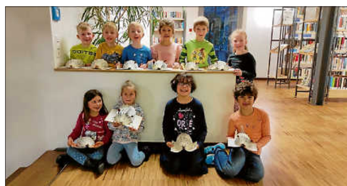
Die Kinder mit ihren Igeln