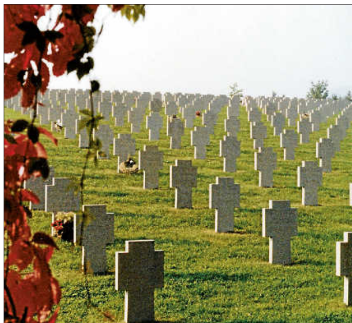
Kriegsgräber in Bergheim/Frankreich

Noch immer tobt der völlig sinnlose Angriffskrieg in der Ukraine. Noch immer gibt es täglich Tote, Verletzte, Vermisste, Vertriebene und Geflüchtete. Und noch immer zeigt uns dieser Krieg die ganze Grausamkeit dessen, was durch ihn und in ihm mit den Menschen geschieht. Das Motto des Volksbundes „Gemeinsam für den Frieden“ scheint ungehört zu verhallen. Das Gefühl, zum ohnmächtigen Zuschauer verurteilt zu sein, bedrückt viele von uns.