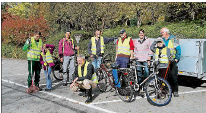
Unsere bunte, hochmotivierte Gruppe beim ersten Sammeltermin

Weißblühenden Kastanienbäumen hilft es, wenn das heruntergefallene Laub vernichtet wird, weil sonst daraus im nächsten Jahr wieder neue Miniermotten aufsteigen. In Urbach finden deshalb Kastanienlaubsammelaktionen statt, bei denen jede/r mitmachen kann.