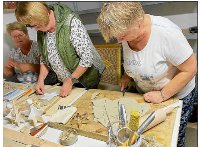
Aber auch Lichterhäuser und Sternleuchter entstanden

Es waren zwei tolle, entspannte Abende und hat riesigen Spaß gemacht.