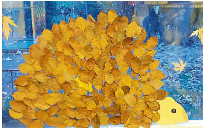
Blätterigel an der Fensterscheibe

quartier zu suchen oder zu bauen. Hast du Lust, in Deinem Garten einen schönen Laubhaufen für diese Tiere zu machen? Warum das Laub immer gleich in die Tonne stecken? Es bietet viele gute Nährstoffe, die die Pflanzen im Garten auch im nächsten Jahr wieder gut gebrauchen können. Vielleicht hast du aber auch Lust, aus den schönen bunten Blättern einen lustigen Igel an deine Fensterscheibe zu machen. Mit Kleister kannst du wunderbar die vorher kurz gepressten Blätter an die Scheibe kleben, und schon lachst dich ein lustiger Igel an.