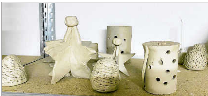
Die ersten Objekte sind noch nicht gebrannt