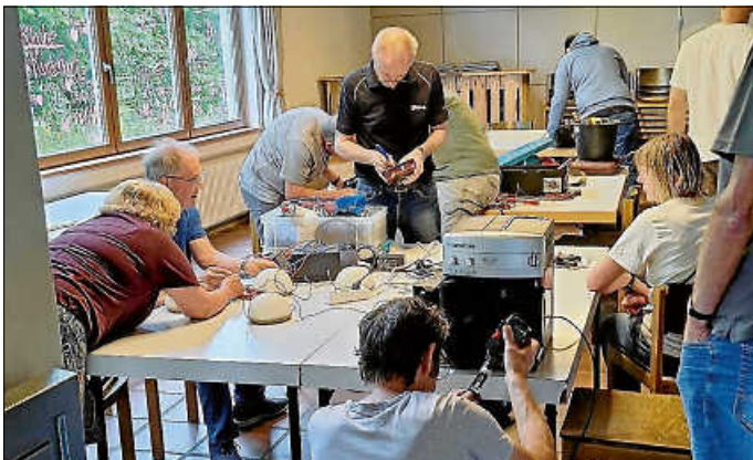
Kundige Fachkräfte beim Reparieren

Am Samstag, den 6. Juli fand in der Friedenskirche der erste Urbacher Repairtag statt. Knapp 20 „Kunden“ kamen mit den verschiedensten Geräten zur Reparatur: Von Kaffeemaschinen über Staubsauger, kaputte Holzstühle, Radiowecker, Kappsägen und Holzspielzeug wurde alles von Experten unter die Lupe genommen und in der Mehrzahl erfolgreich repariert.