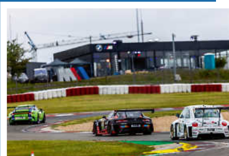
> Beetle RSR #13 in der Startphase des 24h Rennens.

Um das Projekt via PayPal direkt zu unterstützen den QR Code scannen.