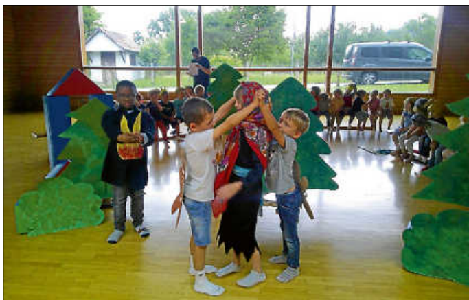
Willkommen im Märchenland!

Am Freitag, den 21. Juni haben wir alle Eltern, Freunde und Verwandten zu einer Aufführung in die Atriumhalle eingeladen und die Kinder haben mit viel Freude ihre Lieblingsmärchen vorgestellt. Die Aufführung wurde mit großem Applaus belohnt.