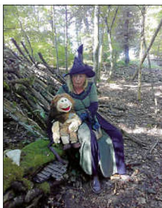
Hexe Petrusilia Fliegenpilz und ihr Zwerg Baldur

Einen märchenhaften Naturtag mit der Hexe Petrusilia Fliegenpilz und dem Zwerg Baldur von Urbach erlebten unsere „FALKEN“ am Montag, den 8. Juli und unsere „KÜKEN“ dürfen sich noch darauf freuen, am Montag, den 15. Juli. Auch diese Aktionen finanzierte unser Elternbeirat von unseren Kuchenverkäufen auf dem Marktplatz.