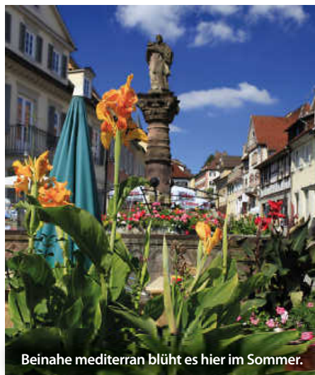
Beinahe mediterran blüht es hier im Sommer.

Geografisch und historisch facettenreich präsentiert sich die Auswahl der Städte. Von gotischen Burgen wie in Wertheim und den charakteristischen Fachwerkfassaden von Mosbach und Schwäbisch Hall spiegelt das Buch die kulturelle Fülle und architektonische Pracht Baden-Württembergs wider.