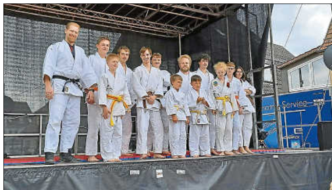
JVU-Abordnung für die Schnitzfetzedede

Wer anhand der Vorführung Lust auf Kampfkunst- und -sport bekommen hat, kann uns gerne auf unserer Homepage (jv-urbach.de) besuchen und sich weitere Informationen zum JVU, Judo, Jiu-Jitsu, Aikido, Taichi und unserer Gesundheitssport-Gruppe einholen. Anfragen gerne an vereinsvorstand@jv-urbach.de, welche dann an die Sportwarte bzw. Trainer der jeweiligen Kampfkunst weitergeleitet werden. Trauen Sie sich, wir haben für Kinder (ab 6 Jahren), Jugendliche und Erwachsene jeden Alters etwas in unserem Sportangebot.