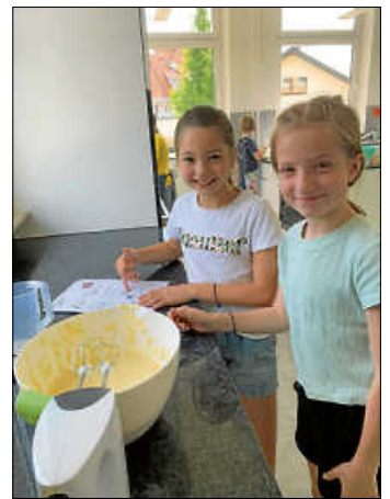
Mit Begeisterung wurden von den Mädels die Amerikaner hergestellt

Das Menü bestand aus einer Fußball-Klößchen-Suppe, Schnecke im Salat, darauf eine Lasagne-Prinzessin auf der Erbse und als Nachtisch Erdbeer-Tiramisu.