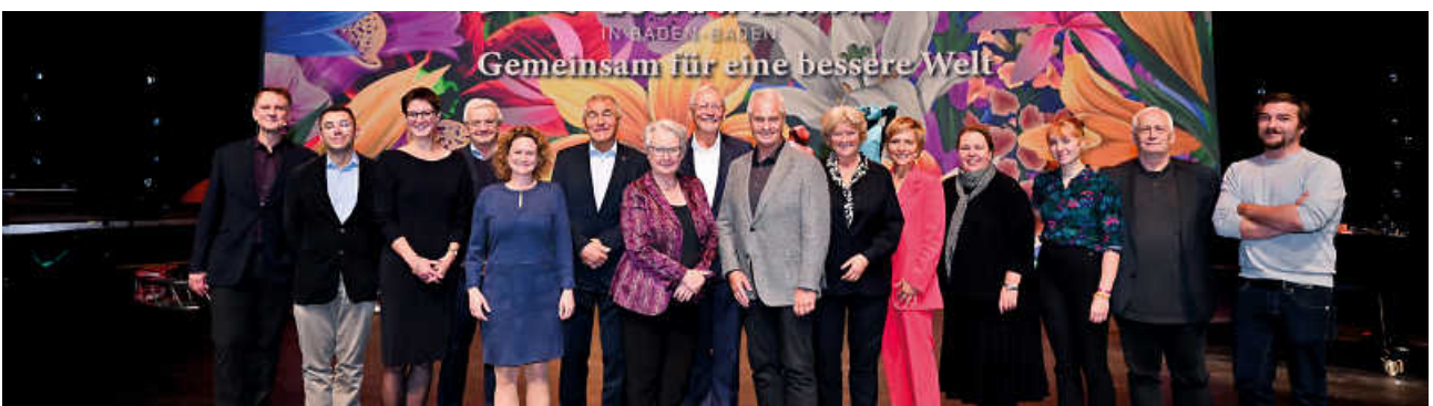
Impressionen vom Forum für Gesellschaftlichen Zusammenhalt 2022 in Baden-Baden.

Buchen Sie jetzt Ihre kostenlosen Tickets!