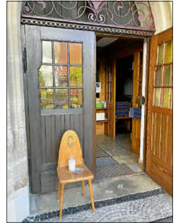
Einladung zur Offenen Kirche

Ein Grund, das Experiment zu starten, sind die seelischen Befindlichkeiten der Menschen nach dem Hochwasser in Urbach. Die geöffnete Kirche bietet einen Ort für Ihre Fragen, für Ihre Klage, für stille Einkehr und für Ihr Gebet. Herzliche Einladung – bitte weitersagen.