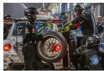
> Boxenstopp des Beetle RSR #13 in der Nacht

Jetzt über den QR-Code direkt mit dem Teamchef in Kontakt treten und das Projekt aktiv unterstützen!