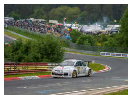
> Beetle RSR #13 in der Grünen Hölle