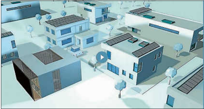
Gewerbegebiet „Blurado“ Radolfzell

Das Projekt soll einen vollständigen Verzicht auf fossile Energieträger durch ein kaltes Nahwärmenetz ermöglichen durch eine sogenannte Agrothermieanlage sowie einer Stromerzeugung mittels Photovoltaikflächen, die zusätzlich zu der Versorgung der Wärmepumpen auch Teile des Stromverbrauchs in den Unternehmen abdecken. Die Gemeinde Radolfzell hat das Unternehmen GETEC mit der Projektierung und der Umsetzung des Projekts beauftragt. Der Bebauungsplan liegt LONA e. V. vor.