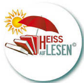
Foto: Logo Fachstelle Öff. Bibliothekswesen Stuttgart

Als Clubmitglied erhaltet ihr ein kostenloses Logbuch, in das ihr die von euch gelesenen Bücher eintragt. Es werden extra für die Aktion viele neue, spannende und lustige Bücher angeschafft, damit euch der Lesestoff in den Sommerferien nicht ausgehen kann, aber ihr könnt natürlich auch auf den gesamten Bestand der erzählenden Kinderbücher zugreifen. Für die ersten fünf von euch gelesenen Bücher erhaltet ihr Losabschnitte, mit denen ihr bei der großen Verlosung an der Abschlussparty teilnehmt. Es lohnt sich also, mindestens fünf Bücher im Laufe der Ferien zu lesen, um die besten Gewinnchancen zu haben. Alle Teilnehmerinnen und Teilnehmer erhalten zum Abschluss eine Urkunde mit Angabe der Anzahl der von ihnen gelesenen Bücher und der gelesenen Seiten! Zu jedem von euch gelesenen Buch erzählt ihr uns kurz etwas, bewertet es (wie mit einer Schulnote) oder schreibt einen kleinen Bericht dazu, ganz wie es euch am besten gefällt. Wer lieber bastelt als liest und gerne kreativ ist, kann auch mit der Bearbeitung der Kreativ-Aufgabe Losabschnitte ergattern! Krönender Abschluss des „HEISS AUF LESEN“-Sommers ist die Abschlussparty mit einer spannenden Veranstaltung (z. B. Autorenlesung oder Kindertheater) und der Verlosung von tollen Preisen. Der Termin der Abschlussparty wird rechtzeitig bekannt gegeben. Interessiert? Dann schau einfach in der Mediathek vorbei! Wir erzählen dir gerne mehr ...