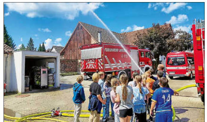
Zum Abschluss hieß es dann Wasser marsch!

Louis erklärte uns, was ein Feuerwehrmann im Einsatz alles benötigt und wo die Notrufe eingehen. Wir waren alle sehr beeindruckt, als er uns zeigte, dass er in ca. 1,5 Minuten seine komplette Ausrüstung inkl. Sauerstoffflasche und Atemschutz anlegen konnte. Stefan zeigte uns die verschiedenen Einsatzfahrzeuge und erklärte uns die Ausrüstung und die Funktion der einzelnen Gegenstände.