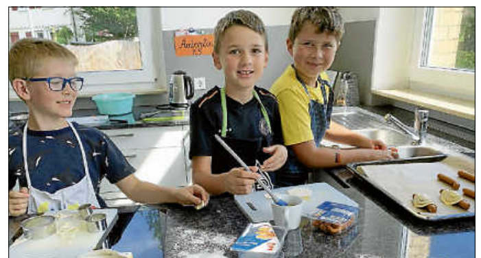
Von den Jungs wurden die lustigen Schnecken zubereitet