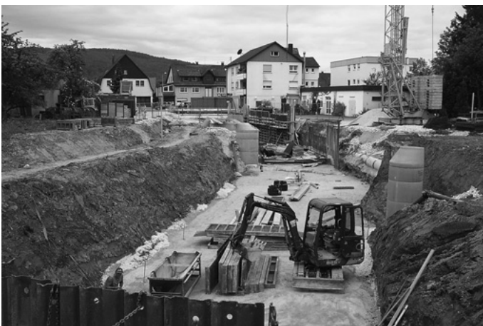
Die Großbaustelle in der Urbacher Mitte schreitet aufgrund der guten Witterung zügig voran. Zeitweise gleichen die beim „Löwen“ entstehenden Bauwerke fast einer U-Bahnstation. Scherzhaft wird in Anlehnung an das Stuttgarter Großprojekt schon von „Urbach 21“ gesprochen.