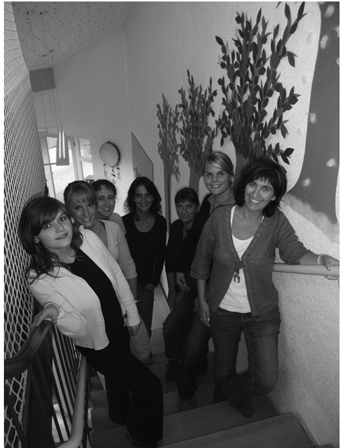
Die Kindertagesstätte „Kunterbunt“ nimmt ihren Betrieb auf. Kinder ab einem Jahr werden dort von einem motivierten Team von Erzieherinnen ganztägig betreut. Auch 7 Plünderhäuser Kinder kommen in die KiTa nach Urbach, ein gutes Beispiel für interkommunale Zusammenarbeit.