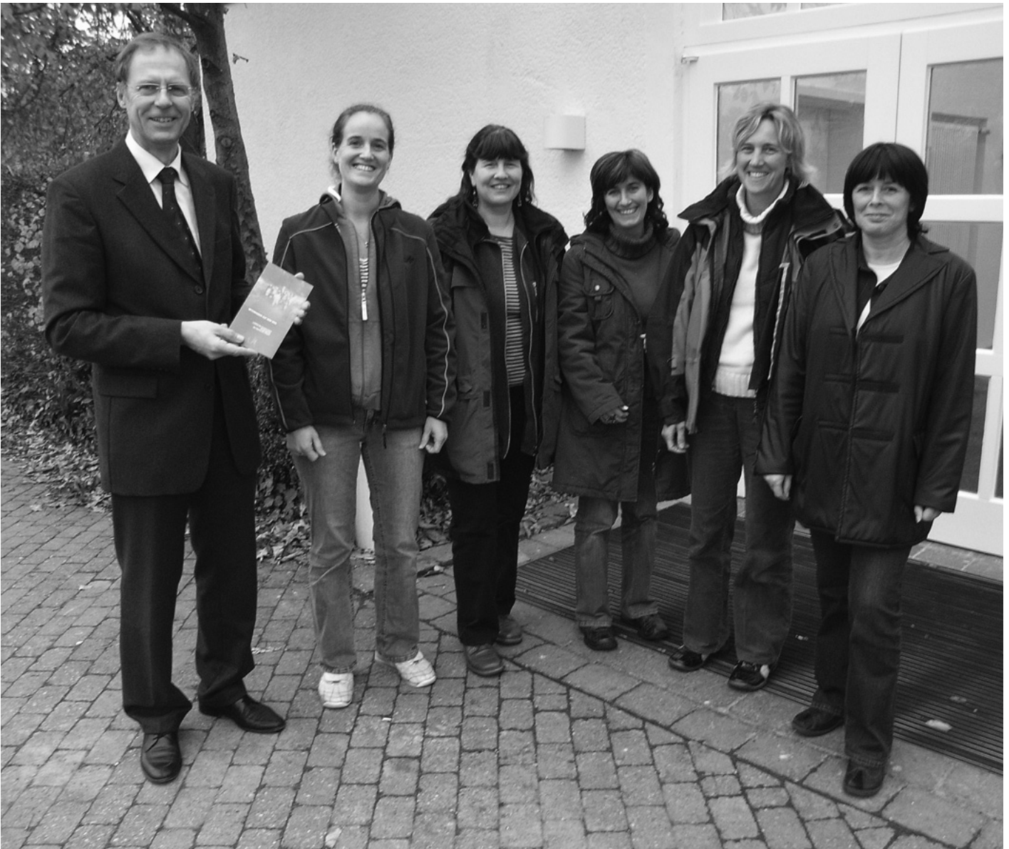
Die Kindergärten der Gemeinde Urbach präsentieren ihr gemeinsames Leitbild. Damit soll in allen fünf von der Gemeinde betriebenen Kindergärten und- tagesstätten ein gleichbleibend hoher Qualitätsstandard erreicht werden.