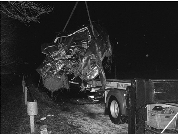
Ein schwerer Verkehrsunfall auf der B 29 lässt das Jahr für die Urbacher Feuerwehr am Neujahrsmorgen nicht gut beginnen.