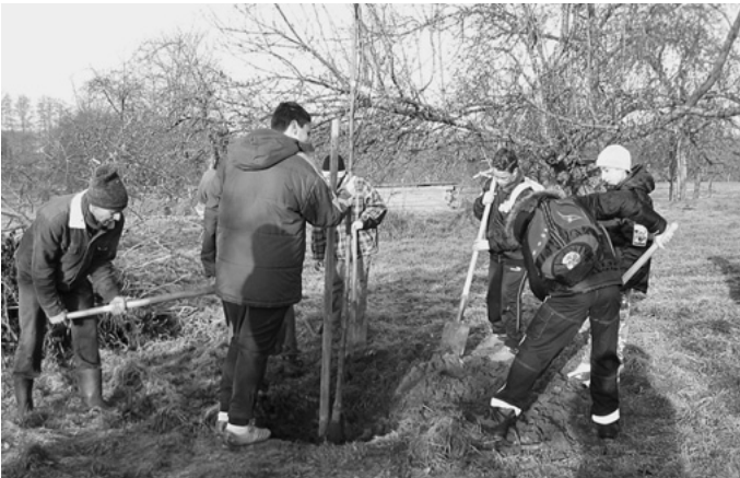
Urbach ist inzwischen Modellgemeinde für Streuobstbau im Rems-Murr-Kreis. Mit einer gemeinsamen Pflanzaktion des Obst- und Gartenbauvereins, des Vereins Hochstamm, der Witwenschule, der Gemeinde Urbach und des Landratsamts Rems-Murr-Kreises beginnt eine ganze Reihe von Veranstaltungen und Aktionen, die das ganze Jahr über zu diesem Thema in Urbach stattfinden werden.