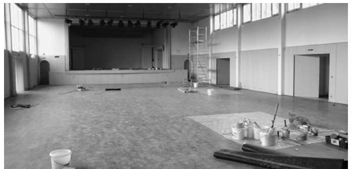
Die gute alte Auerbachhalle erhält nach etwas mehr als 20 Jahren seit ihrer letzten großen Renovierung wieder ein moderneres Erscheinungsbild. So wird nicht nur ein komplett neues Mobiliar angeschafft, sondern auch die Fliesen im Gerundzimmer und Foyer erneuert. Außerdem werden neue Lampen und Vorhänge installiert und alle Räume frisch gestrichen. Auch die Lautsprecheranlage wird auf den Stand der Technik gebracht.