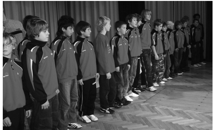
Bei der Urbacher Sportlerehrung zeichnet Bürgermeister Jörg Hetzinger 139 Kinder und Jugendliche und 98 Erwachsene für Ihre sportlichen Erfolge aus; hier die Fußball D-Jgd. des SC Urbach aus der Saison 2006/2007.