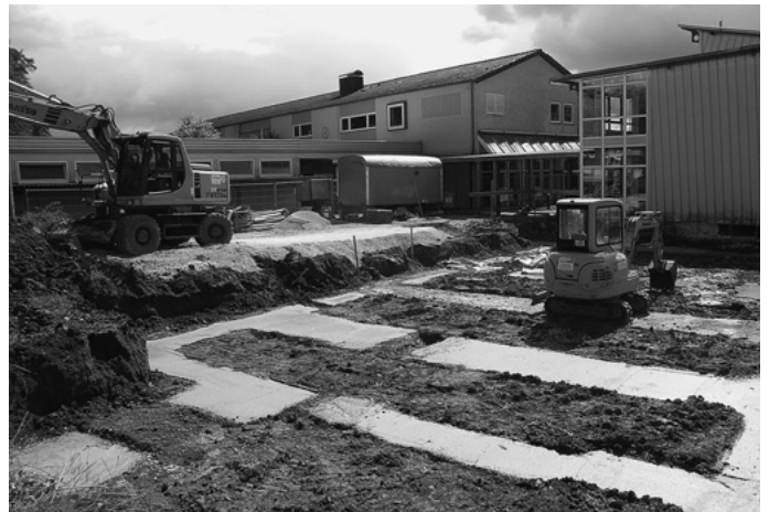
An der Wittumschule fällt der Startschuss zum Neubau einer Schulmensa und weiterer Aufenthaltsräume. Damit werden für 1,18 Mio € die räumlichen Voraussetzungen geschaffen für eine Ganztagesbetreuung von Urbacher Schülerinnen und Schüler. Sie soll ab dem kommenden Schuljahr beginnen.