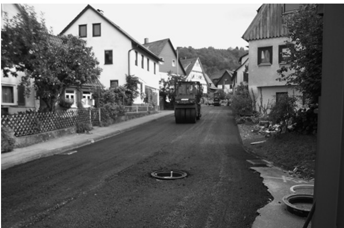
In der Burgstraße und Unteren Seehalde wird die Fahrbahn-decke saniert.