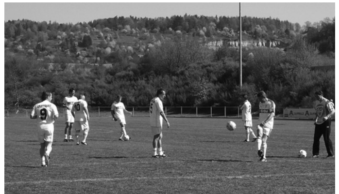
Die Traditionself des VfB Stuttgart mit den Altstars Hansi Müller, „Buffy“ Ettmayer, Karl-Heinz Förster, Maurizio Gaudino, Fritz Walter, Günter Schäfer und vielen anderen spielt im Wittumstadion gegen die Nationalmannschaft der Deutschen Post.