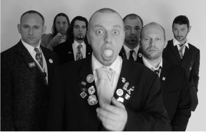
Auch die über die Grenzen Urbachs hinaus bekannte Kabarett und Comedy Reihe startet wieder. Für einen fulminanten Auftakt sorgen die Spaß-Bläser „Mnozil Brass“ aus Österreich.