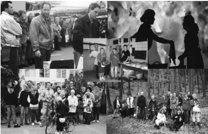
Das Urbacher Frauenforum feiert in der Auerbachhalle mit einem interessanten und abwechslungsreichen Programm sein 20-jähriges Bestehen.