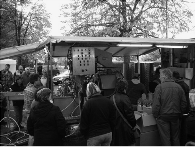
Zum Abschluss der diesjährigen Mostobstsaison können Stücklesbesitzer ihre „Spätlese“-Äpfel beim „Saftpressen für Familien“ auf dem Freibadparkplatz an Ort und Stelle zu (haltbarem) Apfelsaft verarbeiten lassen. Mehr als 3.000 Liter Apfelsaft werden an diesem Tag ausschließlich von Obst aus Urbacher Streuobstwiesen gekeltert.