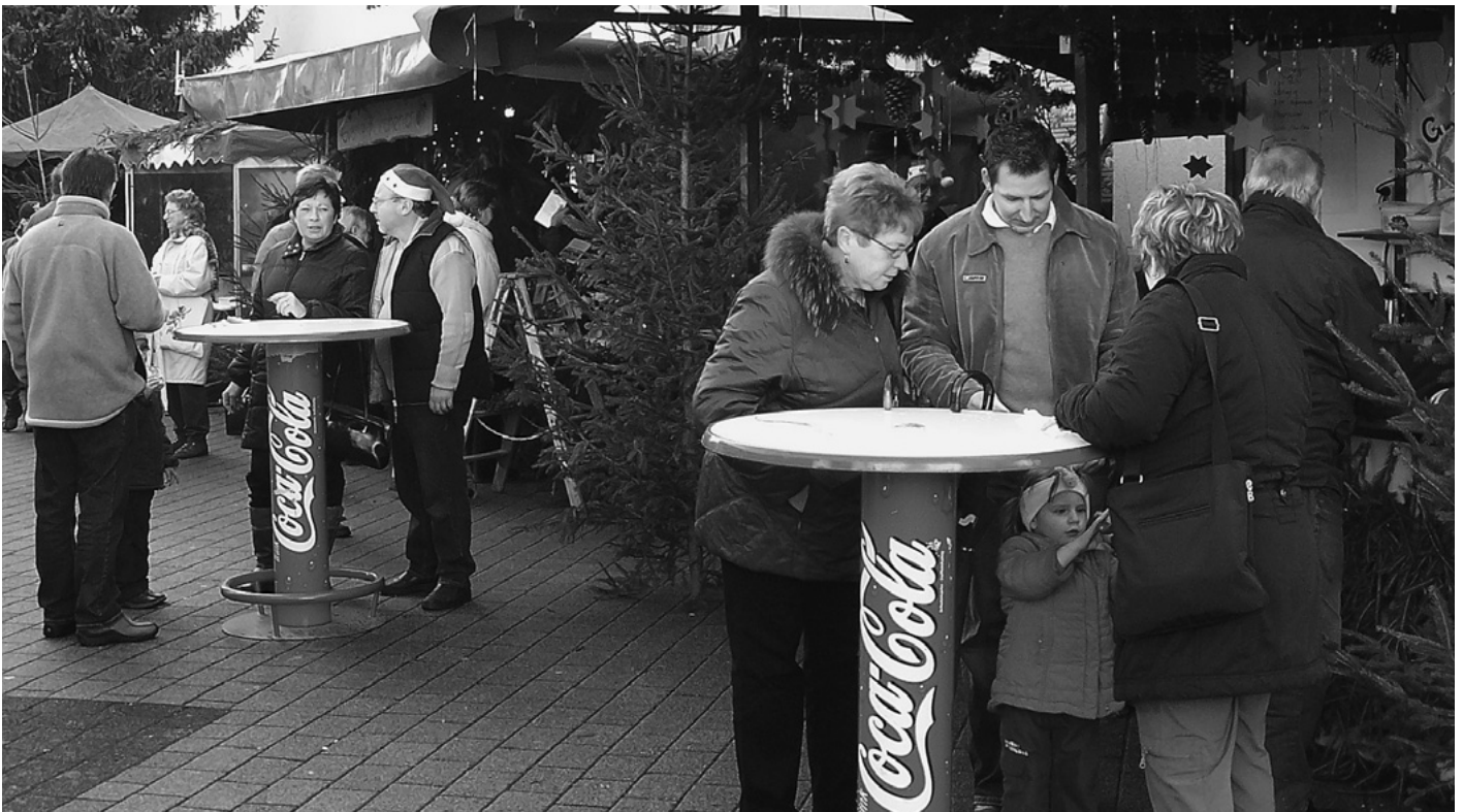
Bei regnerischem Wetter findet rund um das Rathaus der 24. Urbacher Weihnachtsmarkt statt. Der Besucherzustrom ist trotz des mäßigen Wetters sehr gut.