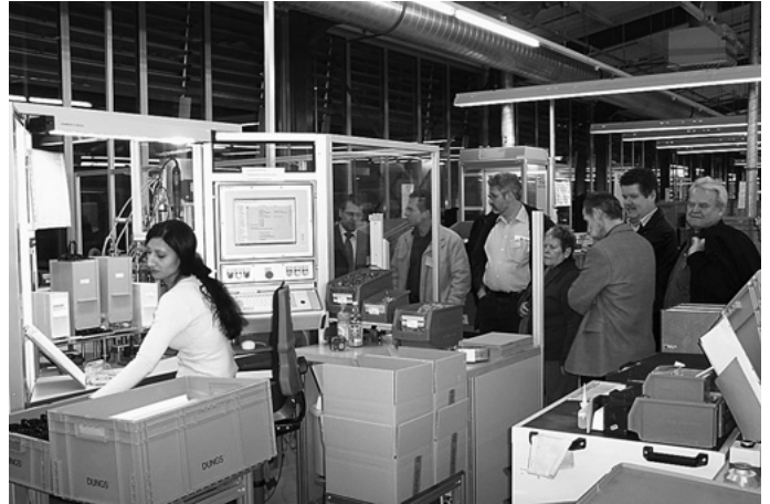
Der Gemeinderat sowie die Verwaltungsspitze informieren sich über Urbacher Betriebe. Auf dem Besuchsprogramm im Januar stehen die Firmen Rolladen Lutz und Dungs.