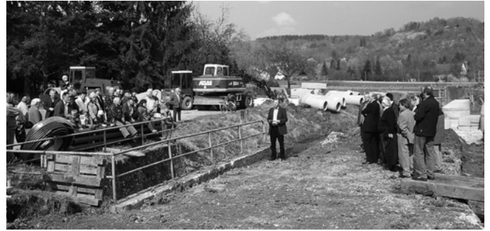
Mit einem symbolischen ersten Spatenstich fällt der Startschuss zur Erschließung der Urbacher Mitte. Bis zum Jahresende wird u. a. eine neue Verbindung zwischen der Friedhofstraße und der Hauptstraße gebaut, die Wohnstraßen, Ver- und Entsorgungsleitungen für Wohn- und Geschäftsgebäude gelegt.