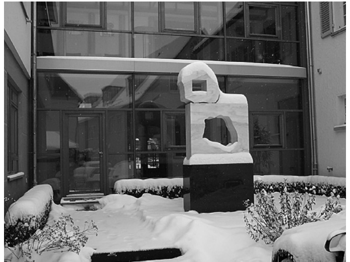
Ein bisschen Schnee gibt's auch in diesem Winter. Die Skulptur von Hüseyin Altin im Hof des Rathauses ist für wenige Tage mit der weißen Pracht überzogen.