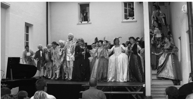
Ein kultureller Höhepunkt im Veranstaltungskalender der Gemeinde ist das Urbacher Schlosskonzert, das heuer zum dritten Mal stattfindet. Hochkarätige Sängerinnen und Sänger in tollen Gewändern sowie das historische Ambiente im Urbacher Schlosshof machen das Konzert nicht nur zu einem besonderen Hörerlebnis, sondern auch zu einem Augenschmaus.