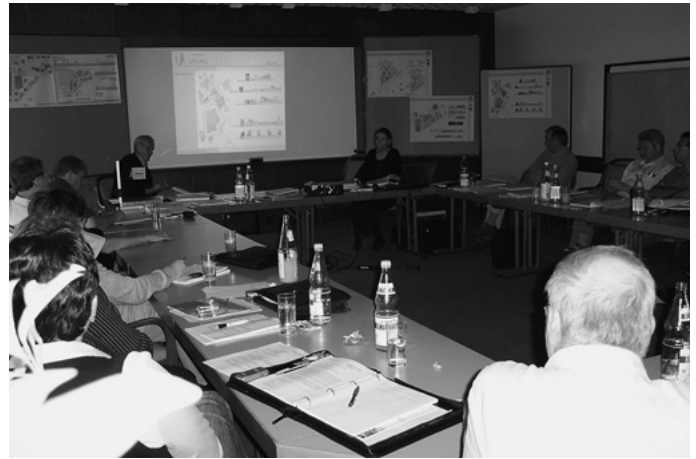
Der Urbacher Gemeinderat geht in Klausur. Die Ratsdamen und -herren diskutieren in Mainhardt-Stock zukunftsweisende Themen einmal ohne zeitlichen Druck, so unter anderem die Freibadsanierung und den Regionalplan.