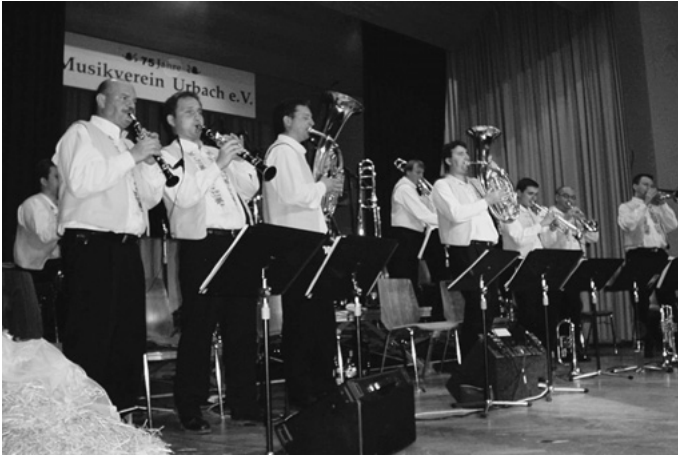
Der Musikverein Urbach feiert sein 75-jähriges Bestehen. In und bei der Auerbachhalle wird drei Tage lang mit abwechslungsreichem Programm gefeiert.