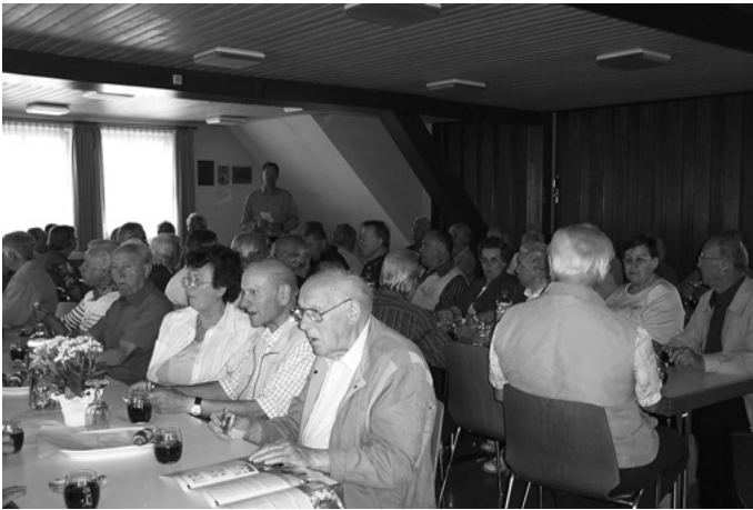
Traditionell gut besucht ist der Rentnerschoppen im Feuerwehrhaus, bei dem der Bürgermeister der älteren Generation von Urbach Rede und Antwort steht.