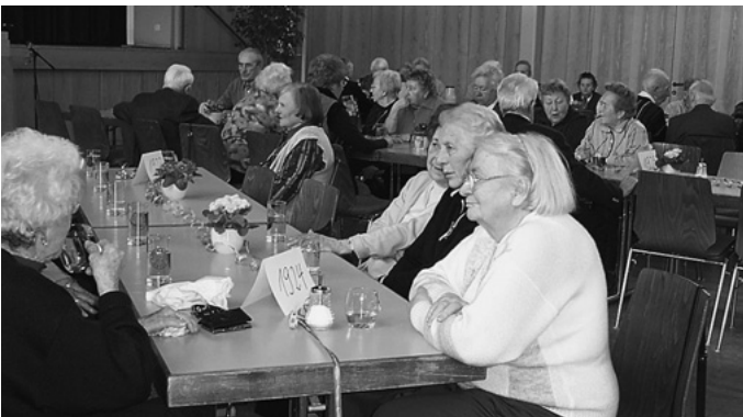
Im Rahmen des Seniorenprogramms findet ein Treffen der Jahrgänge 1916 bis 1926 statt. Fast 50 Personen kommen bei Kaffee, Kuchen oder einem Viertele zum Wiedersehen in die Auerbachhalle.