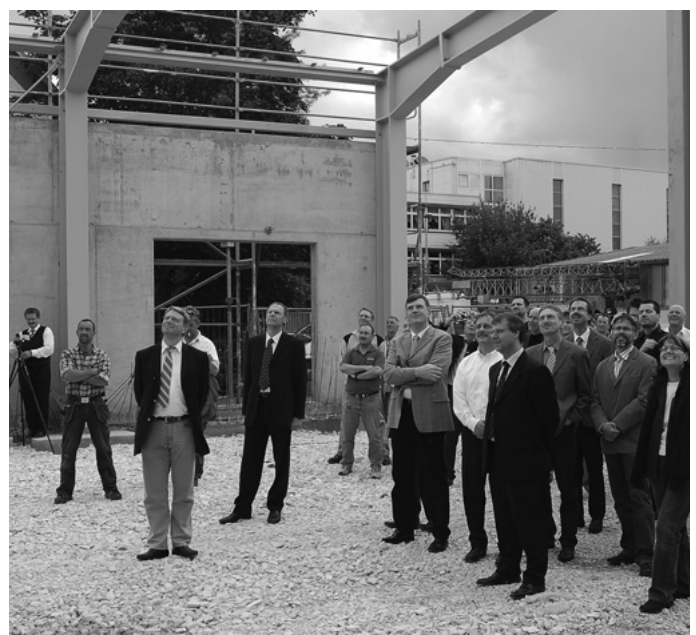
Die Firma Dungs in der Wasenstraße, der größte Arbeitgeber in Urbach, expandiert. Nach 10-monatiger Bauzeit wird Richtfest an der neuen Produktionshalle gefeiert. Insgesamt entstehen bei der Erweiterung 3.100 m 2 mehr an Produktionsflächen.