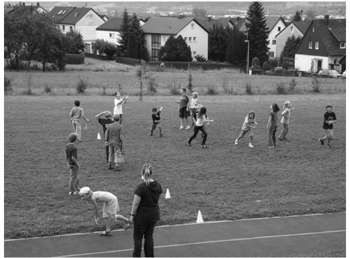
Auch bei der Stadtranderholung ist jeden Tag Sport, Spiel und Spannung für die jungen Teilnehmerinnen und Teilnehmer geboten. Nicht nur ein abwechslungsreiches Programm, sondern auch leckeres Essen gibt es für die Kinder, deren Eltern in den Ferien arbeiten müssen.