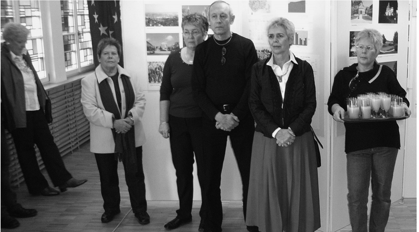
Anlässlich des Weihnachtsmarkts und des Besuchs einer Frauengruppe aus Szentlőrinc präsentiert die Partnerschaftsgruppe aus Urbach eine viel beachtete Fotoausstellung über die Aktivitäten in der Partnerschaft mit Szentlőrinc.