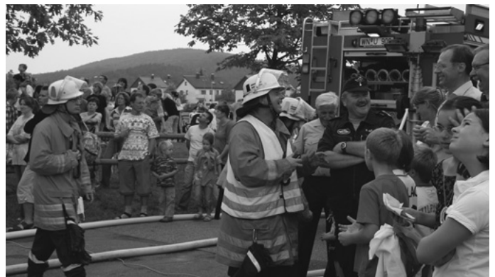
Ein Höhepunkt beim diesjährigen Schulfest an der Atriumschule ist sicher die Hauptübung der Feuerwehr. In eindrucksvoller Weise präsentieren die Urbacher Floriansjünger nicht nur ihren Fuhr- und Gerätepark, sondern wie man schnell und effektiv Menschen aus einem brennenden Gebäude rettet.