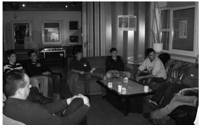
Das Jugendhaus macht einen Tag zur Berufsorientierung für Jungen. Das ist nur eines von mehreren Angeboten, die über das Jahr hinweg im „UYC“ für Mädchen und Jungs angeboten werden, damit sich die Jugendlichen für den für sie richtigen Beruf entscheiden können.