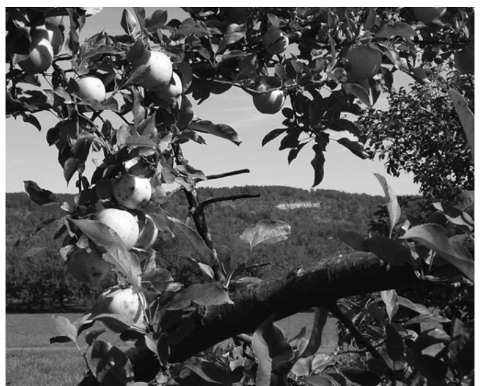
Sehr früh beginnt in diesem Jahr die Apfelernte. Bereits ab Mitte August werden die Früchte geerntet und zu den Sammelstellen gebracht. Ertrag und Preis sind in diesem Jahr sehr gut.