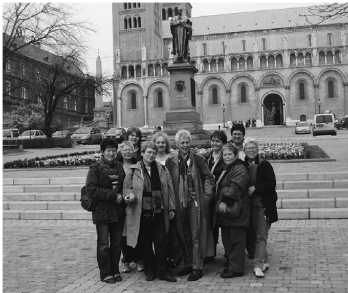
Das Urbacher Frauenforum besucht die Partnerstadt Szentlőrinc in Ungarn.