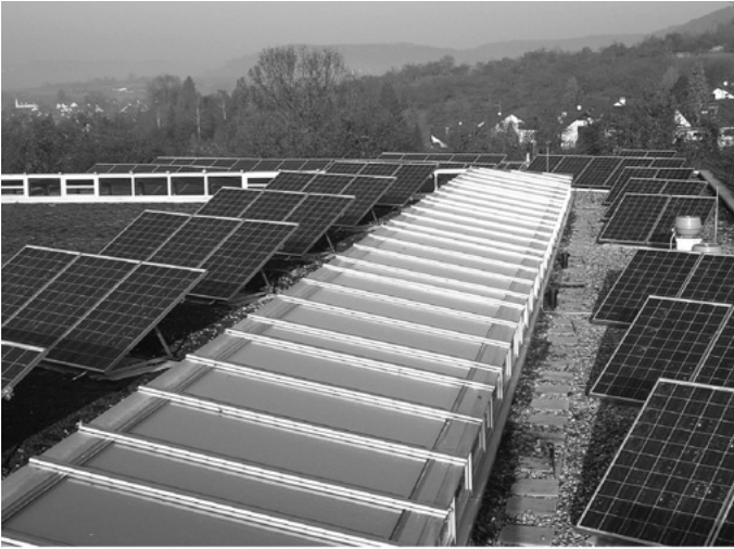
Wie die EnBW mitteilt, sind inzwischen 30 Fotovoltaikanlagen in Urbach in Betrieb, die insgesamt rund 187.500 kWh Strom produzieren. Dies entspricht dem Jahresstrombedarf von 53 Haushalten und einer Kohlendioxid-Einsparung von immerhin 96 Tonnen.