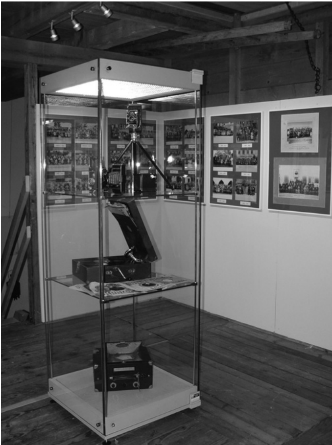
Im Museum „Farrenstall“ findet erstmals eine Sonderausstellung „Urbacher Jahrgänge“ 1857 bis 1862 statt, die großen Anklang findet.