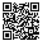
Code scannen und Petition unterstützen

Die Petition wird von der Polizeigewerkschaft sowie etlichen Tier- und Umweltschutzorganisationen unterstützt. Zusammen für eine lebenswerte Zukunft!