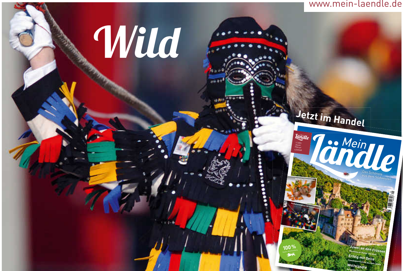
Die Summe der vielen, kleinen Besonderheiten Baden-Württembergs