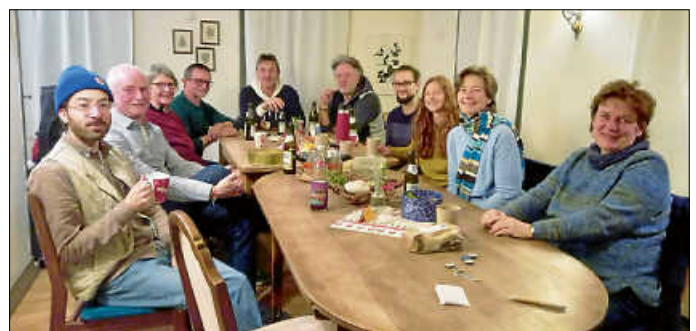
Bei unserer Weihnachtsfeier mit Punsch und Früchtebrot