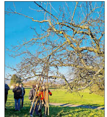
Guter Schnitt