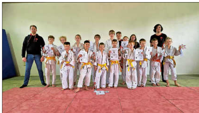
Judo-Kids mit ihren erkämpften Nikoläusen

Als Ergebnis die Liste der Siegerinnen und Sieger: