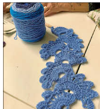
Es wird auch gehäkelt.

Einfach vorbeischaun oder melden unter landfrauen-urbach@gmx.de