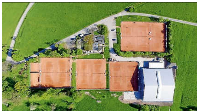
Unsere tolle Anlage