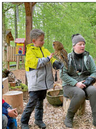
Mit dem Waldkauz Rosalie

So viele tolle Erfahrungen in einer Woche!