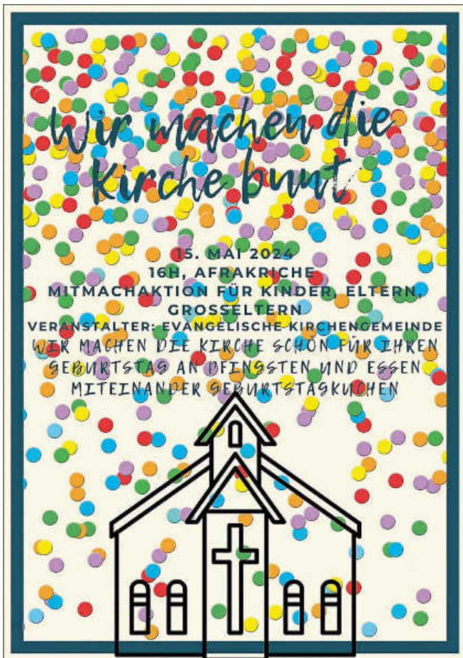
Wir machen die Kirche bunt am 15.05.24 um 16 Uhr, Afrakirche