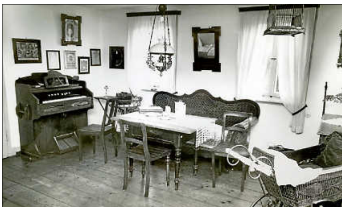
Die Heimatstube in der Mühlstraße 98 im Jahr 1987

Ein erster Impuls dafür, das Wissen über die Geschichte der Gemeinde zu bewahren und zu pflegen, um es an die nach uns kommenden Generationen weitergeben zu können, war die 800-Jahr-Feier im Jahre 1981 und das Erscheinen des Buches „Acht-hundert Jahre Urbach“. Aufgrund eines Aufrufs im Mitteilungsblatt entstand 1986 die Arbeitsgruppe „Heimatstube Urbach“. Ziel dieser aus Urbacher Bürgern bestehende Arbeitsgruppe war es, historische Gegenstände, Schriftgut und Bildmaterialien für ein späteres Heimatmuseum zu sammeln, zu archivieren und für Präsentationen oder Veröffentlichungen aufzubereiten. Am 10. Februar 1987 beschloss der Gemeinderat, das ehemalige Gebäude Mühlstraße 98 der „Heimatstube Urbach“ zu überlassen. Und schon bald entstanden die ersten Ausstellungen. 1987 zum Thema „Leben und Arbeiten um die Jahrhundertwende in Urbach“ und 1988 zum Thema „Festen und Feiern“. Der große Erfolg dieser ersten Ausstellungen motivierte die Gruppe zum Weitermachen.