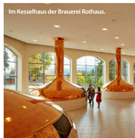
Im Kesselhaus der Brauerei Rothaus.

Also auch bei uns im Ländle. Mit einer Vielzahl an Brauereien, von historisch bis modern, bietet Baden-Württemberg vom klassischen Pils über traditionelle Klosterbieren bis hin zu ausgefallenen Craftbier-Kreationen eine Geschmacksvielfalt, die ihresgleichen sucht. Und der Tag des deutschen Bieres bietet Anlass für die Brauereien, diese zu zelebrieren. Ob auf Bierfesten oder bei speziellen Verkostungen – der Tag feiert das, was Baden-Württemberg in Sachen Bier so einzigartig macht.