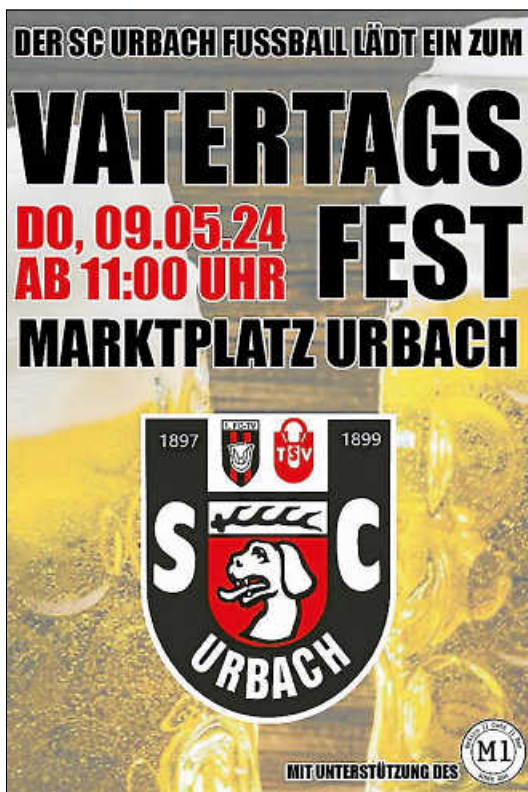
Vatertagsfest auf dem Urbacher Marktplatz