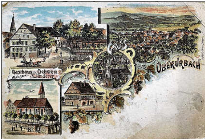
Postkarte von ca. 1900 mit Ansichten des Ochsen mit Kegelbahn, der Afrakirche mit Pfarrhaus und des alten Rathauses

Eine Archivrecherche im vergangenen Jahr nahm sich dem Oberurbacher Ortskern genauer an und untersuchte die Funktion, die Besitzverhältnisse und die Entwicklung des Quartiers in den vergangenen 200 Jahren. Der Vortrag präsentiert die Ergebnisse dieser Gebäudeforschung und beleuchtet anhand von historischen Fotografien, Ansichtskarten und Plänen die Veränderungen rund um die Afrakirche.