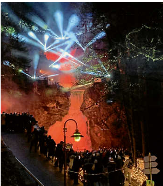
Viel Wasser, viel Licht – die Tribberger Wasserfälle spektakulär illuminiert

In der Dunkelheit sah dann alles noch schöner aus, vor allem die tollen Lichteffekte im Wald und die nett beleuchteten Figuren. Highlights an diesem Tag waren dann die (mehrmals täglich stattfindende) spektakuläre Feuershow, die den Wasserfall in ein Farbenspiel aus Flammen hüllte und ein bezauberndes Feuerwerk am Ende. Wir kamen aus dem Staunen nicht mehr raus.