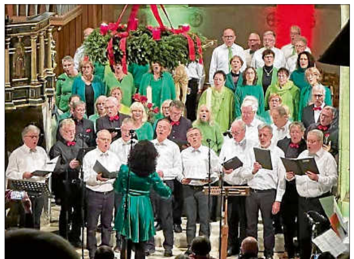
Alle zusammen singen „Friede auf Erden“