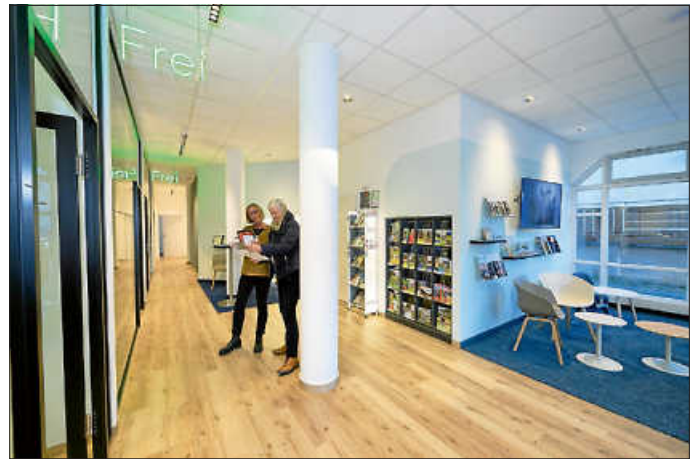
So präsentiert sich der Wartebereich des neuen Servicebüros

Im EG, wo sich früher einmal der Drogeriemarkt Schlecker befand, bietet die Gemeindeverwaltung viele Dienstleistungen in hellen und freundlichen Büros an wie Anmeldungen, Reisepässe und Personalausweise, die Entgegennahme von Führerscheintträgen, Gewerbeanmeldungen und -abmeldungen, Kartenvorverkauf für Veranstaltungen, touristische Informationen und vieles mehr. Daneben befindet sich auch das Standesamt in dieser Nebenstelle der Gemeindeverwaltung.