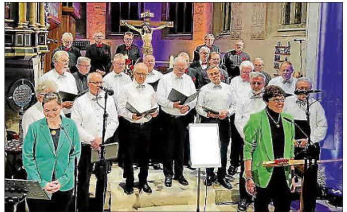
Der Männerchor mit den beiden Moderatorinnen

Zum Abschluss kamen dann noch einmal alle beteiligten Sänger und Sängerinnen zusammen, um allen Gästen mit dem Lied „Friede auf Erden“ eine schöne friedvolle Weihnachtszeit zu wünschen. Die Zuhörer und Zuhörerinnen dankten den Chören mit tosendem Applaus und viel positiver Resonanz und so ließen alle Beteiligten den schönen Abend mit Glühwein oder Punsch auf dem Kirchplatz ausklingen.