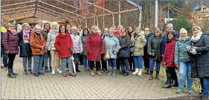
Urbacher Landfrauen auf Reisen ...

Zu einem spektakulären Erlebnis ging es mit dem voll besetzten Bus am 29.12.23 nach Triberg in den Schwarzwald zu Deutschlands höchstem Wasserfall.