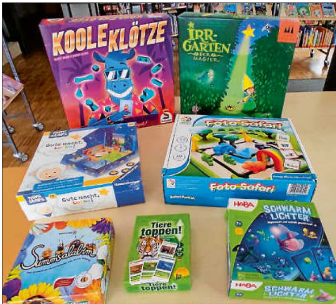
Neue Spiele, gespendet für die Mediathek

Unser Urbacher Spieleprofi Andreas Gütler hat uns erneut kurz vor Weihnachten mit einer großzügigen Spiele-Spende erfreut. Inzwischen sind die neuen Spiele in den Bestand der Mediathek eingearbeitet worden und können natürlich von unseren Spielefans ausgeliehen werden. Es handelt sich um folgende Spiele: „Irrgarten der Magier“ (Drei Magier) für 2 bis 4 Spieler ab 5 Jahren, das Kartenspiel „Tiere toppen!“ für 2 bis 5 Spieler ab 8 Jahren mit interessanten Fakten aus der Tierwelt, „Summsalabim“ für 2 und mehr Spieler ab 5 Jahren, „Schwarmlichter“ (HABA), ein Unterwasserspiel ab 7 Jahren, „Kooole Klötze“ (Schmidt) für 3 bis 6 Spieler ab 8 Jahren und „Gute Nacht, Locke!“ für die ganz Kleinen ab 18 Monaten (Ravensburger), zum spielerischen ins Bett Begleiten. Ganz herzlichen Dank an Andreas Gütler für diese tolle Spende zugunsten der Mediathek!