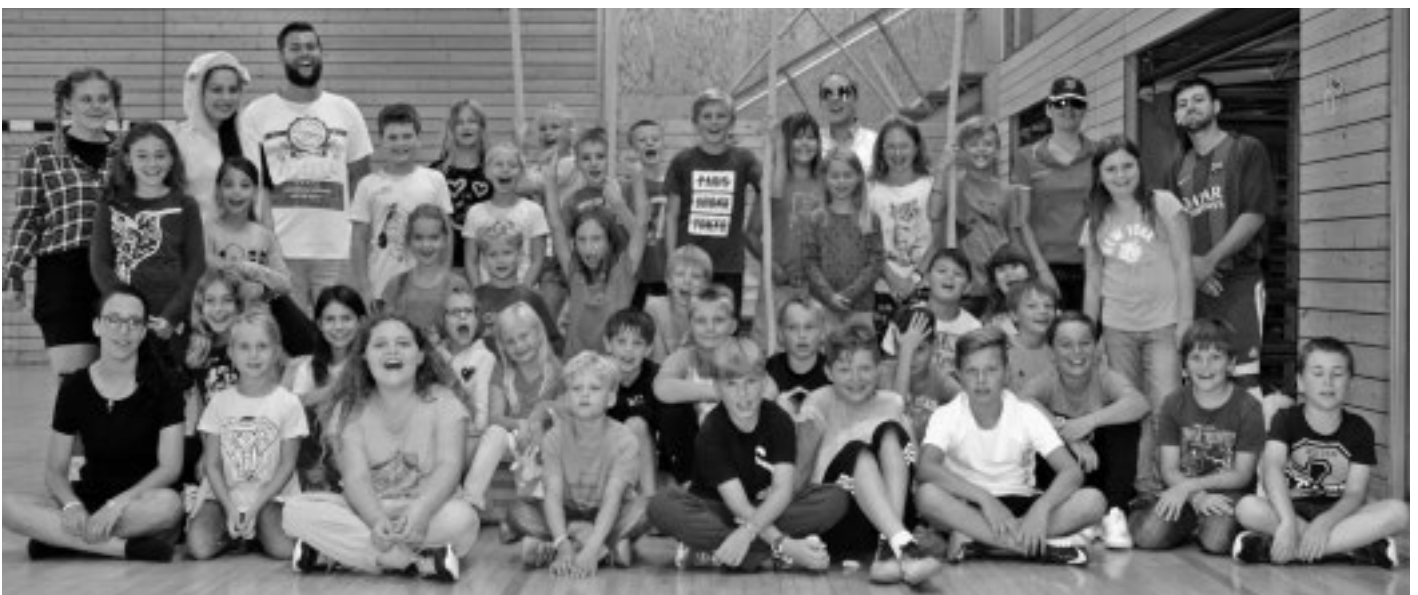
Ein Renner ist neben dem klassischen Ferienprogramm der Gemeinde und der Vereine, bei denen es wieder unter 75 Angeboten auszuwählen gilt, auch die Schülersommerferienbetreuung an der Atriumhalle. Von rund 60 Familien wird dieses Angebot der Gemeinde in Anspruch genommen.