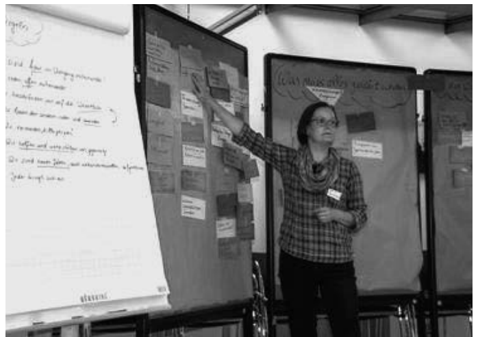
Verschiedene Arbeitsgruppen von engagierten Bürgerinnen und Bürgern kommen zu unterschiedlichen Themen im Zusammenhang mit der Remstal Gartenschau 2019 zu ihren ersten Treffen zusammen