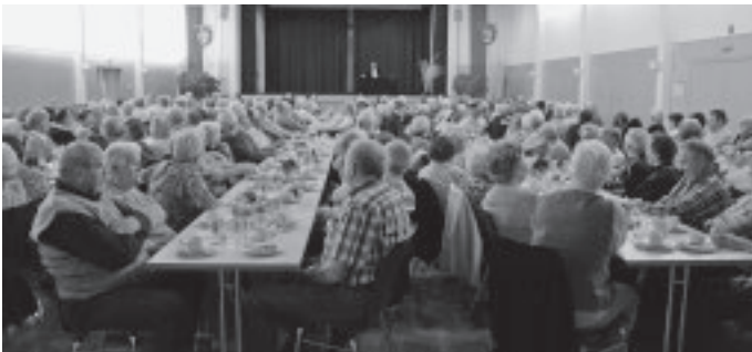
Zum ersten Mal findet der „Urbacher Frühlingsplausch“ statt, eine Gemeinschaftsveranstaltung von Gemeinde, Kirchen, Vereinen für Seniorinnen und Senioren. Sportliches, Musikalisches, Kabarettistisches und selbstverständlich Kaffee und Kuchen und Vesper werden den Besucherinnen und Besuchern in der voll besetzten Auerbachhalle geboten.