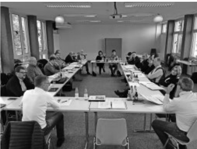
Der Gemeinderat begibt sich in Klausur. Zwei Tage lang wird in den Tagesräumen des Schlosses Flehingen im Kraichgau der Haushaltsplan und die Finanzen durchforstet und diskutiert.