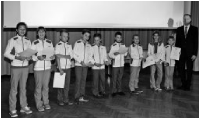
185 erfolgreichen Sportlerinnen und Sportler aus Urbach ehrt die Gemeinde bei ihrer Sportlerehrung in diesem Jahr. Bürgermeister Hetzinger freut sich in seiner Ansprache, dass besonders viele Kinder und Jugendliche unter den Geehrten zu finden sind, wie die angehenden Tennis-Cracks des TCU hier auf dem Bild.