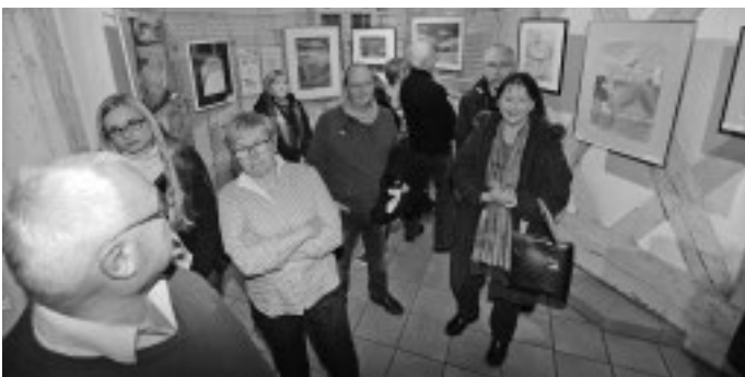
Eine Woche früher als sonst laden die Künstlerinnen und Künstler der Gruppe „MalWe“ zu ihrer Ausstellung im Museum ein. Vielfältig und wie gewohnt von außerordentlich hoher Qualität sind die Bilder, Skulpturen und das Kunsthandwerk, die dem interessierten Publikum präsentiert werden.