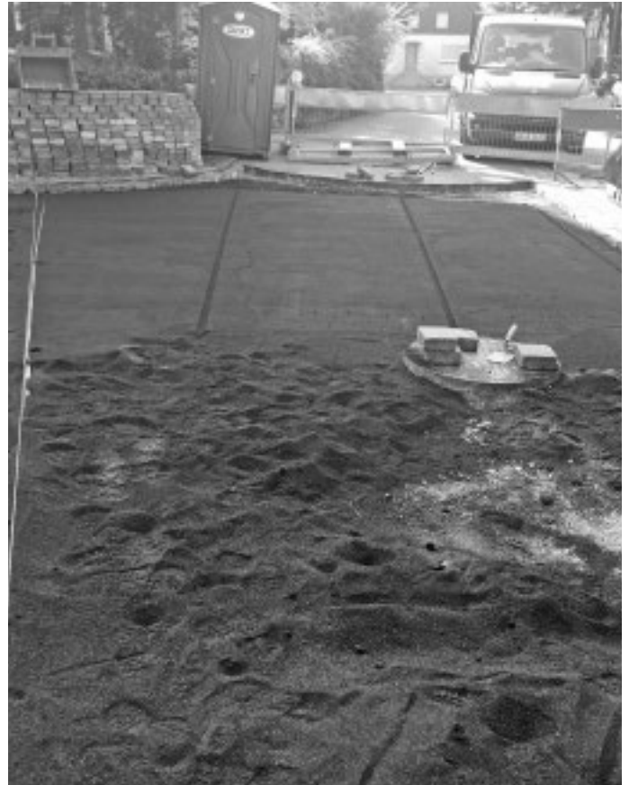
In der Schlosstraße werden, wie zuvor schon in der Beckengasse, die lockeren Pflastersteine neu verlegt und saniert.