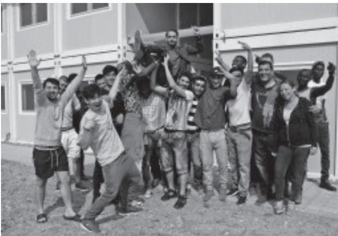
Nach langer Wartezeit ziehen die ersten Flüchtlinge Anfang des Monats endlich in die neue Unterkunft bei der Wasenmühle ein. Damit endet auch die Zeit, in der die Espachhalle als Notunterkunft für rund 40 Flüchtlinge aus Gambia, Pakistan und Afghanistan hat herhalten müssen.