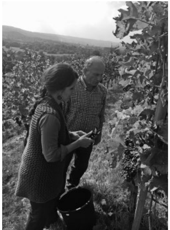
Im Gemeindewengert am Linsenbergr erfolgt die Traubenlese. In diesem Jahr werden die roten Trauben weiß geherbstet. Eine gute Qualität der Trauben lässt auf ein spritziges Tröpfchen hoffen.