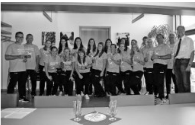
Die Fußball-Frauen des SC Urbach sind erneut Meister geworden - diesmal in der Regionalliga. Dies bedeutet den Aufstieg in die Landesliga. Die rasante Entwicklung des Frauenfußballs beim SC Urbach dokumentiert sich durch den Aufstieg von der Kreisliga in die Bezirksliga in der Saison 2013/14 und den nochmaligen Aufstieg von der Bezirks- in die Regionalliga eine Saison später.