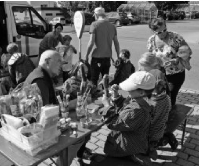
Eine tolle Bürgeraktion zur Remstal Gartenschau ist das Bemalen der so genannten Leitvögel bei der neu geschaffenen Waldbank an der Friedhofstraße. Die Leitvögel sollen später als Wegweiser für den Walderlebnispfad dienen, der zwischen Hagparkplatz und Bärenbachtal derzeit neu kozipt wird.