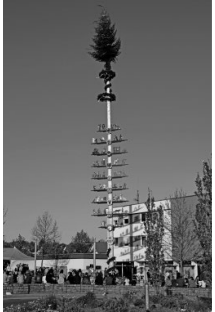
Der Urbacher Maibaum ziert wieder für einen Monat den Marktplatz in der Urbacher Mitte. Er gehört zu den größten und schönsten in der Umgebung, wie allgemein befunden wird.