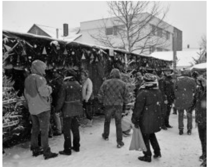
„Ski und Rodel gut“ ist die Devise beim 34. Urbacher Weihnachtsmarkt. Gleich zu Beginn des Marktes setzt starkes Schneetreiben ein, was insbesondere ältere Menschen vom Besuch des Marktes abhält. So sind die Besucherzahlen in diesem Jahr nicht wie gewohnt hoch, Die Betreiber der rund 60 Stände mit Weihnachtlichem, Selbstgemachtem, Kunsthandwerk, Grünschnuck, Glühwein, Bratwurst, Döner und vielem mehr nehmen es weitgehend gelassen.