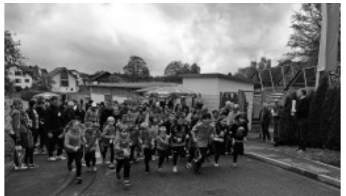
Trotz bescheidenen Wetters finden sich wieder zahlreiche Läuferinnen und Läufer ein zum 4. Jedermann Spendenlauf zugunsten von „Kind und Jugend – Bürgerstiftung Urbach“. Dieser Event gilt gemeinsam mit der Freibadhockeyse gleichzeitig auch als der Startschuss für die neue Freibadsaison.