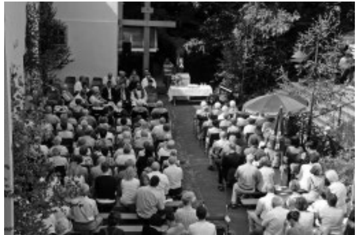
Herrliches Frühsommerwetter herrscht in diesem Jahr beim ökumenischen Gottesdienst im Schlosshof.