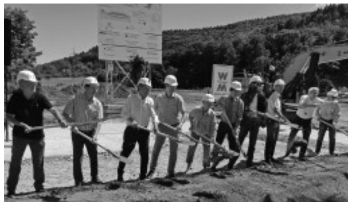
An der Rems erfolgt mit viel Prominenz der erste Spatenstich für das Hochwasserrückhaltebecken Nr. 4 zwischen Plüderhausen und Urbach.