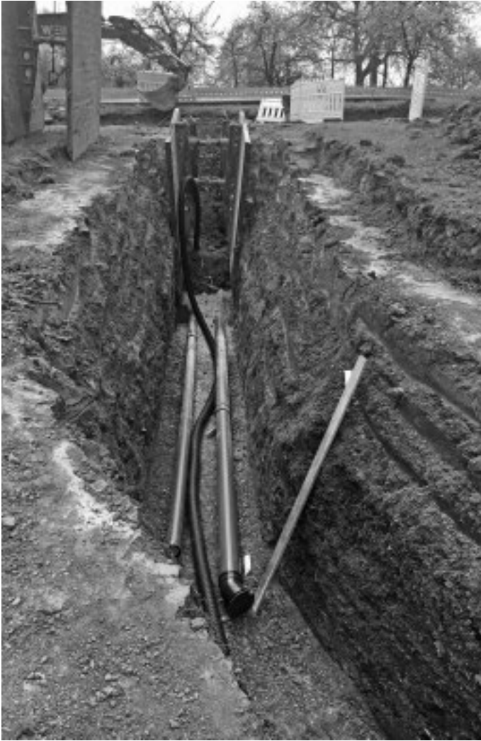
Dem Ende entgegen gehen die Leitungsarbeiten zwischen Bärenbachtal und Wasserhochbehälter Leitersberg, die dazu dienen, die gemeindeeigenen Quellen wieder an das Trinkwassernetz der Gemeinde anzuschließen.