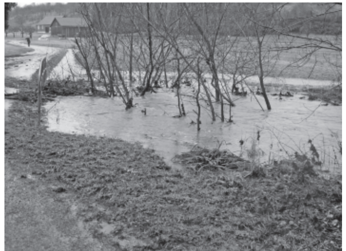
Nach dem Schnee kommt das Hochwasser. Am 13. Januar bringen starke Regenfälle verbunden mit extremem Tauwetter den Urbach im Gutenauer Tal und den Bärenbach zum Überlaufen.