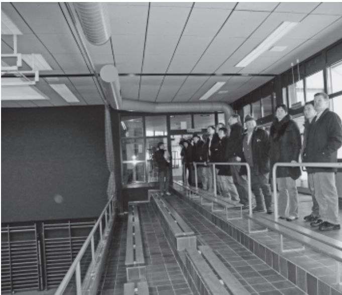
Wie jedes Jahr unternimmt der Gemeinderat „zwischen den Jahren“ seinen Inventurrundgang. Auf dem Programm stehen begonnene Projekte und solche, die man angehen möchte, wie hier die Renovierung der Wittumhalle..