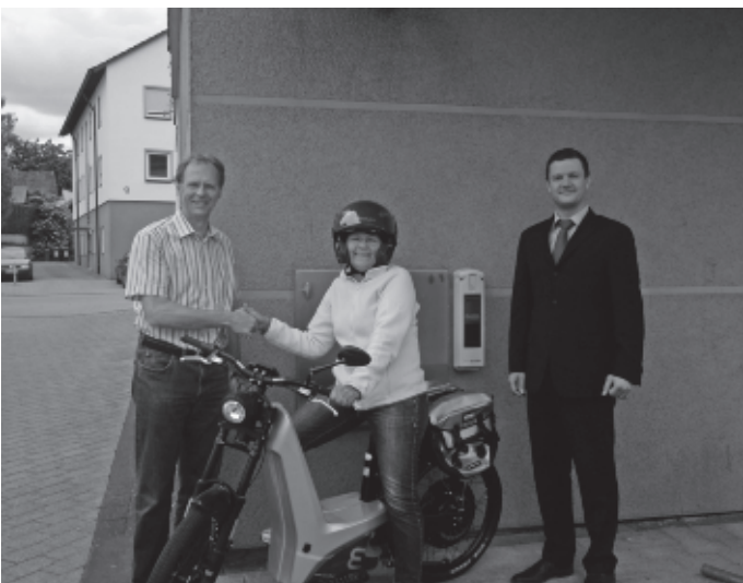
Urbach wird E-Mobil. Im Rahmen eines Forschungsprojekts erhält die Gemeinde von der EnBW ein E-Bike, mit dem die Bediensteten der Gemeinde fortan ihre Dienstgänge erledigen können. Am Rathaus wird eine E-Tankstelle eingerichtet.