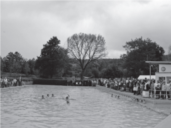
Nach dem Neubau des Umkleidetrakts und dem Neubau eines Kassenhäusles wird Ende des Monats endlich und heiß ersehnt das Freibad wieder eröffnet. Leider setzt pünktlich dazu kühles „Schmuddelwetter“ ein.