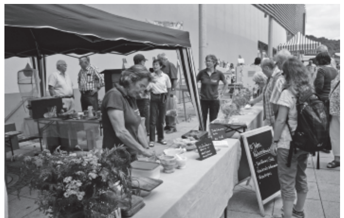
Die Naturerlebnistage an den Urbacher Schulen werden seit 10 Jahren durchgeführt. Dieses kleine Jubiläum wird ebenfalls auf dem Markt gefeiert, unter großer Anteilnahme der Schülerinnen und Schüler und pädagogisch wertvoll.