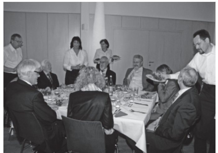
In der festlich dekorierten Auerbachhalle ließen es sich dabei die Gäste bei leckeren Speisen und Getränken sowie angenehmer musikalischer Unterhaltung gut gehen und taten damit auch noch ein gutes Werk.