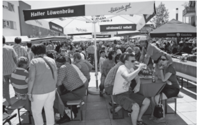
Der Naturparkmarkt mit einem großen kulinarischen Angebot aus dem gesamten Naturpark Schwäbisch Fränkischer Wald findet erstmals in Urbach statt.