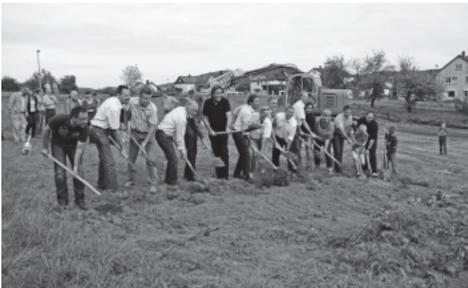
Auf der von der Gemeinde erworbenen Freifläche zwischen Atriumschiule und Bärenhofstraße erfolgt der 1. Spatenstich für das nächste Großprojekt der Gemeinde.

Das Kindehaus, in dem bis Anfang 2013 40 Betreuungsplätze für Kleinkinder unter 3 Jahren geschaffen werden, schlägt mit Kosten von rund 2,9 Mio. € zu Buche.