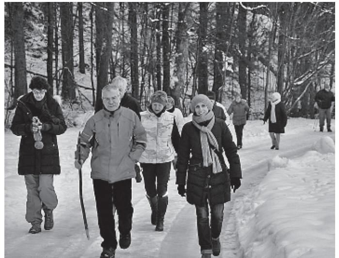
Der Winter zeigt sich zunächst von seiner schönsten Seite und animiert zu schönen Spaziergängen durch die verschneite Landschaft, wie hier bei Dreikönigswanderung des TC Urbach.