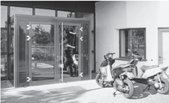
In Wittumhalle und Auerbachhalle werden u.a. die Eingangs- und Zwischentüren erneuert. Brandschutztechnische Vorschriften erfordern diese mit rund 120.000 € sehr kostenintensive Sicherheitsmaßnahme.