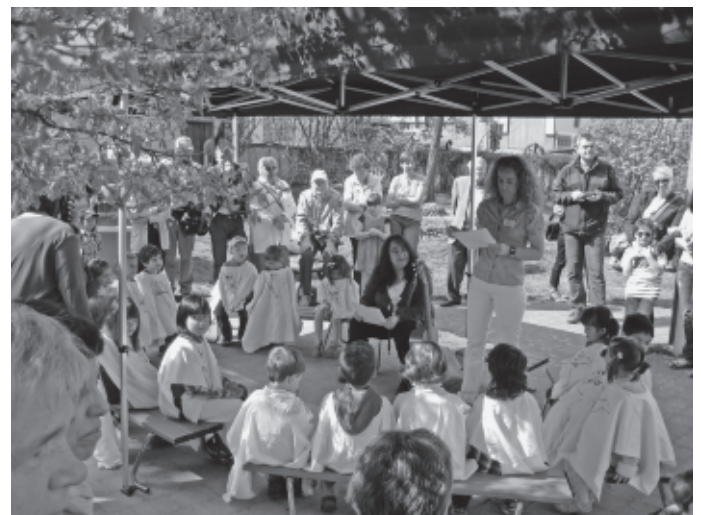
Auch der Schlosskindergarten feiert mit einem (Schloss)gespensterfest sein 20-jähriges Bestehen.