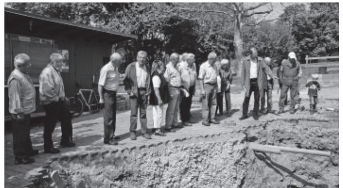
Beim Rentnerschoppen erfahren die Jungseniorinnen und –senioren immer vom Schultes persönlich, was es Neues gibt im Flecken – hier die Baustelle im Freibad, die die Eröffnung der Badesaison in diesem Jahr unvorhergesehen verzögert.