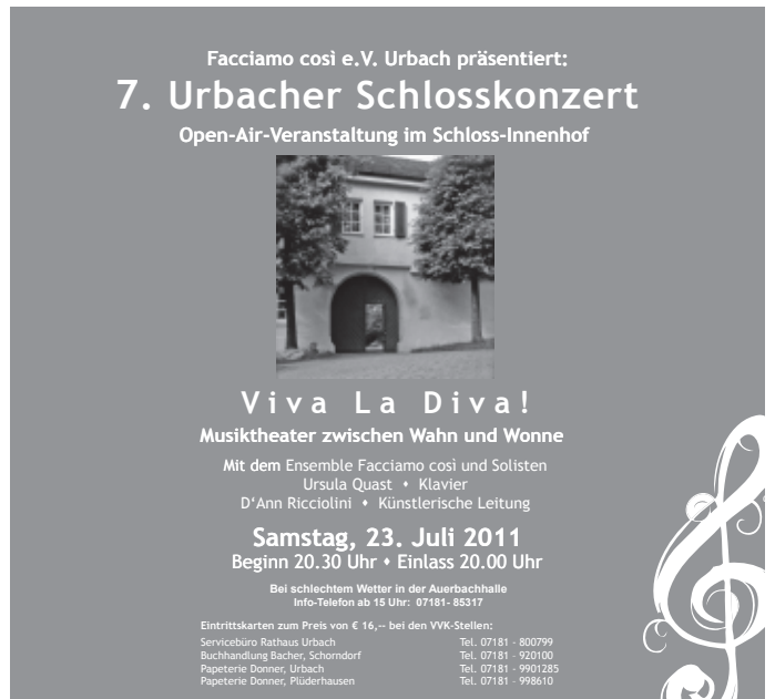
Das mit Freude erwartete 7. Urbacher Schlosskonzert muss leider wegen schlechten Wetters erneut im Saale stattfinden.