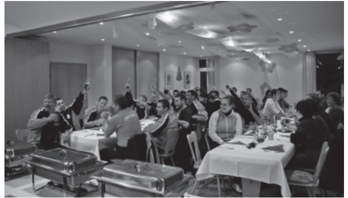
Erstmals und extra zur Einweihung des Kunstrasenspielfeldes ange-reist ist eine Mannschaft von Szentlőrinc SE, dem Fußballverein unserer Partnerstadt. Schon beim ersten Aufeinandertreffen wurde neben dem sportlichen Wettkampf viel und anhaltend gefeiert. Und manch' eine begonnene Freundschaft wird sicherlich beim Gegenbesuch der Urbacher im nächsten Jahr in Szentlőrinc weiter vertieft.