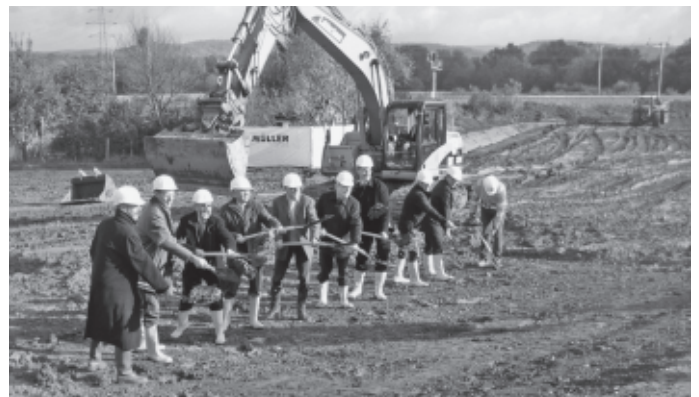
Bei der Kleingartenanlage zwischen Urbach und Schorndorf erfolgt der erste Spatenstich für ein Überführungsbauwerk über die Bahnlinie, das ab 2013 den dortigen Bahnübergang ersetzen soll.