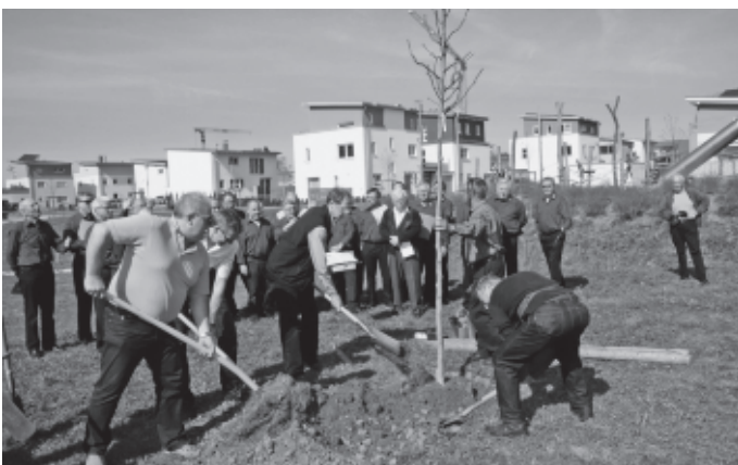
Beim Tag des Baumes wird in der Urbacher Mitte bei einer Sitzgruppe am Urbachweg ein Walnussbaum gepflanzt. Die Patenschaft übernimmt der Obst- und Gartenbauverein Urbach.