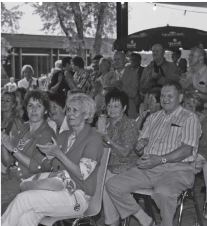
Die Gemeinde lädt ein zum Sommerempfang an der Atriumschule. In lockerer Runde hören die Gäste aus dem Munde von Bürgermeister Jörg Hetzinger Aktuelles zum Gemeindegesehen. Außerdem bleibt auch Zeit für zwanglosen „Small-Talk“