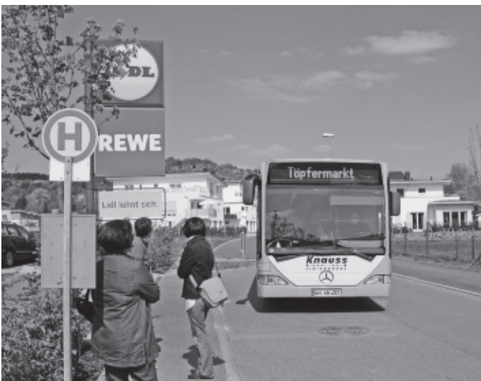
Erstmals wird in diesem Jahr ein Shuttle-Bus eingesetzt, der von den großen Parkplätzen im Ort die Besucher bequem und kostenlos zum Töpfermarkt bringt.