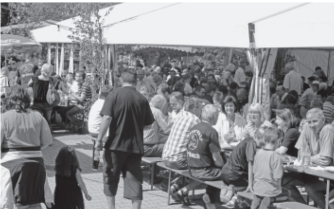
Zahlreiche Hocketsen und Vereinsfeste versüßen den Erwachsenen die Wochenenden, wie hier das traditionelle Schwenkbratenfest mit Tag der offenen Tür bei der Feuerwehr.