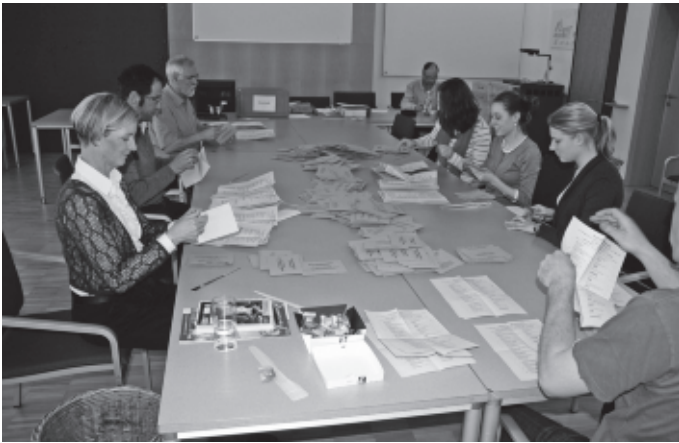
Bei der Landtagswahl erreicht die CDU in Urbach ein Ergebnis von 41,9%, die SPD 23,6%, die Grünen 20,5% und die FDP 6,3%. Die Wahlbeteiligung liegt bei 70,9%