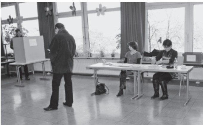
In Baden-Württemberg findet erstmals eine Volksabstimmung über „Stuttgart 21“ statt. In Urbach votieren 66,4 % für den Weiterbau des Bahnprojekts, 33,6 % sind dagegen. Die Abstimmungsbeteiligung liegt bei beachtlichen 60,2%