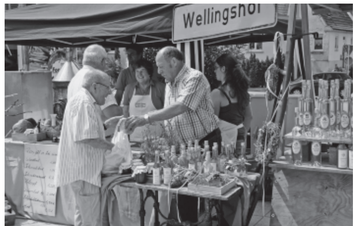
An 40 Ständen wie diesem gibt es Obst, Gemüse, Kunsthandwerkliches, Fleisch, Wurst, Käse, Lederwaren, Schnaps und Liköre, Wein und Sekt und vieles mehr – alles regional erzeugt!