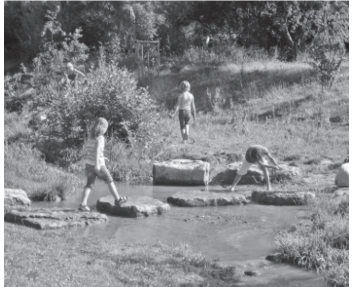
Die Schülersommerferienbetreuung hat sich zu einem echten Hit entwickelt. 17 Kinder im Alter von 6 bis 12 Jahren von berufstätigen Eltern erfahren dort eine Betreuung, die richtig Spaß macht.