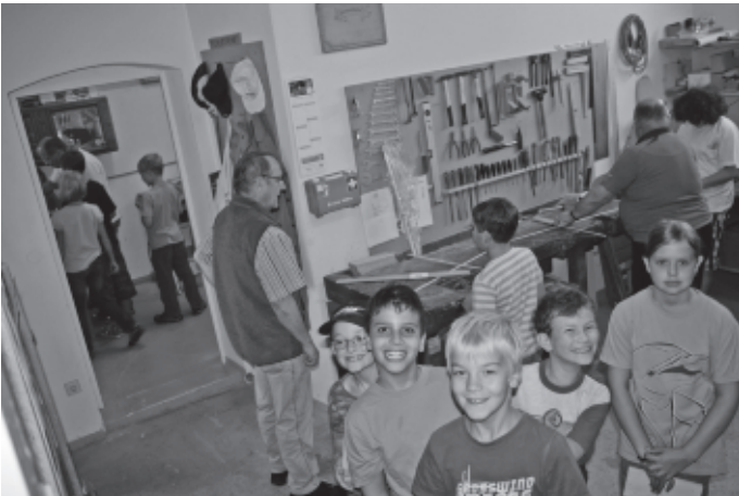
Das Ferienprogramm startet mit vielen attraktiven Veranstaltungen für Daheimgebliebene, wie hier das Basteln und Werkeln in der Holzwerkstatt im Schloss.