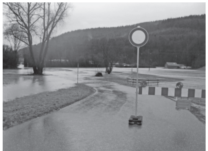
Die Rems verlässt ihr Bett nur im Bereich Herrenwiesen/Kläranlage und verursacht glücklicherweise keine größeren Schäden.