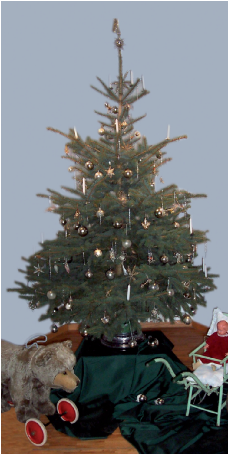
Christbaumausstellung im Rathaus 2008