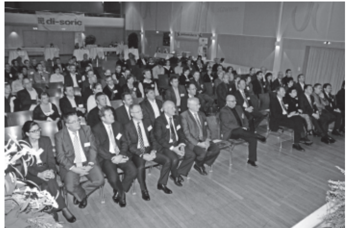
Rund 100 Gewerbetreibende aus Urbach treffen sich in der Auerbachhalle zum Urbacher Unternehmerforum. Prof. Dr. Armin Nassehi spricht zum Thema „Der Ausnahmezustand als Normalfall – warum wir Krisen zugleich unter- und überschätzen“