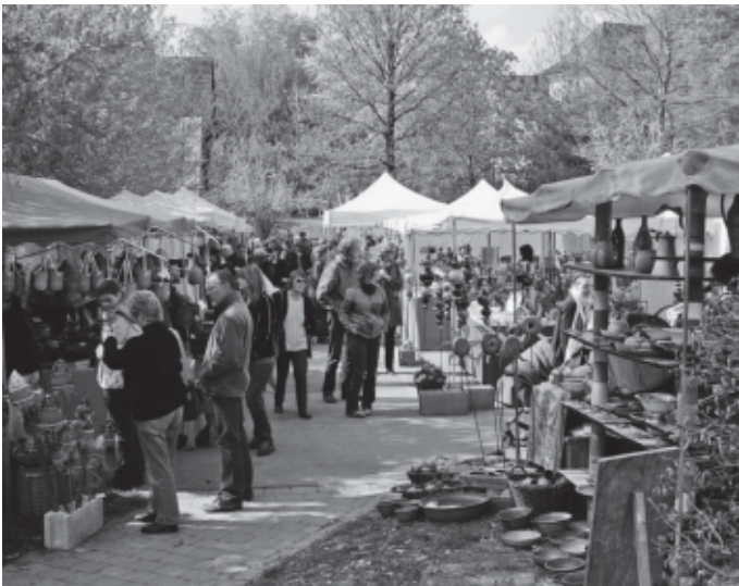
Bereits zum 21. Mal pilgern hunderte von Freunden der Keramik und des Kunsthandwerks – in diesem Jahr wegen Ostern etwas früher – als sonst zum Remstalcer Töpfermarkt beim Schloss Urbach.