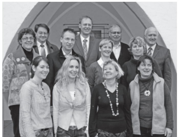
Der Stiftungsrat von „Kind und Jugend – Bürgerstiftung Urbach“ beschließt die ersten Förderprojekte.