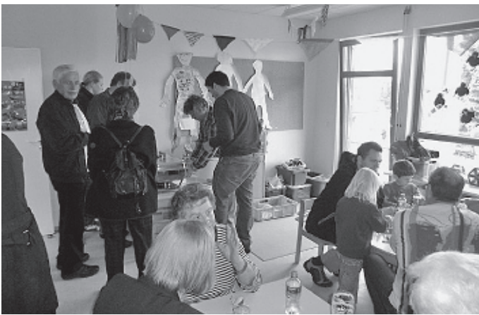
Der Kindergarten Lerchennest feiert mit einem Tag der offenen Tür sein 20-jähriges Bestehen. Erzieherinnen und Kinder vermitteln dabei Einblicke in ihre tägliche Arbeit und stellen Ihre Konzeption vor.